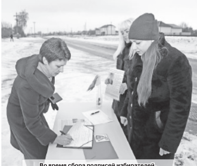
Во время сбора подписей избирателей.

Так, в сельские избирательные комиссии по выборам депутатов районного Совета депутатов 28-го созыва подано 49 заявлений, зарегистрировано 48 инициативных групп граждан по сбору подписей избирателей в поддержку лиц, предлагаемых