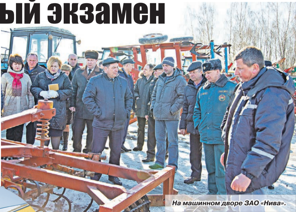
На машинном дворе ЗАО «Нива».