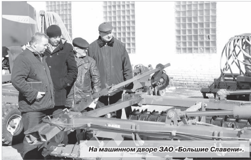
На машинном дворе ЗАО «Большие Славены».

На протяжении дня была проанализирована работа каждой сельхозорганизации района