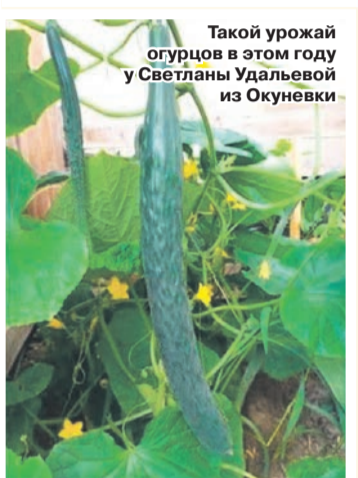
Такой урожай огурцов в этом году у Светланы Удальевой из Окуневки