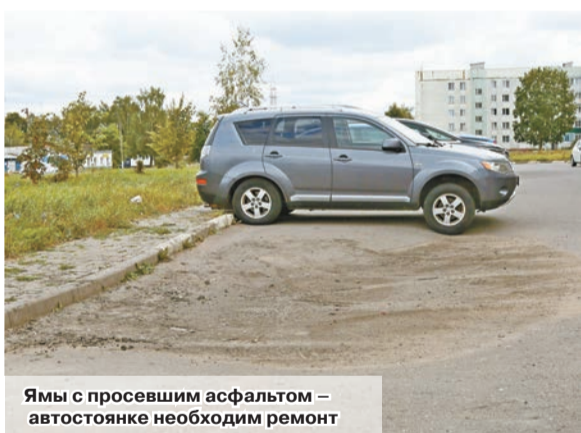
Ямы с просевшим асфальтом – автостоянке необходим ремонт

Действительно, проблема существует. С ней ознакомились и мы, посетив автостоянку. О ровном асфальтовом покрытии здесь говорить не приходится. Две большие глубокие с просевшим асфальтом ямы во время дождей заполняются водой. И, как заметил проходивший мимо житель дома, в них можно уток разводить. До домашней птицы дело, наверное, не дойдет. Будем надеяться, что эти недостатки, а также сорную растительность возле подъездов ликвидируют работ-