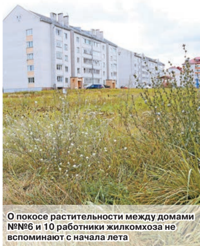
О покосе растительности между домами №№6 и 10 работники жилкомхоза не вспоминают с начала лета

Марина РАНДИЦКАЯ marion795@mail.ru