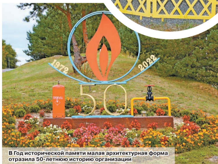
В Год исторической памяти малая архитектурная форма отразила 50-летнюю историю организации

Встреча конкурсной комиссии проходила в торжественной обстановке. Сотрудники РГС стремились показать специфику Шкловщины как огуречного