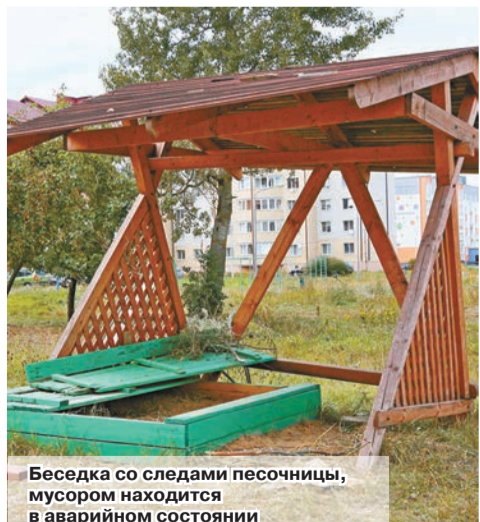
Беседка со следами песочницы, мусором находится в аварийном состоянии