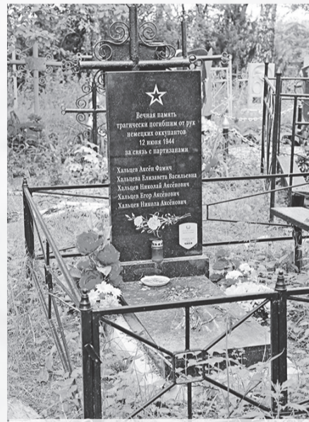
В этом году на гражданском кладбище в деревне Дивново установлен памятник, увековечивший память трагически погибших мирных жителей