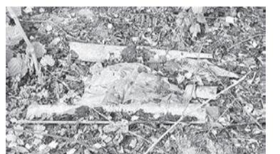
Такие «стихийные свалки» находятся в лесу вблизи полигона сбора ТБО г.Шклова