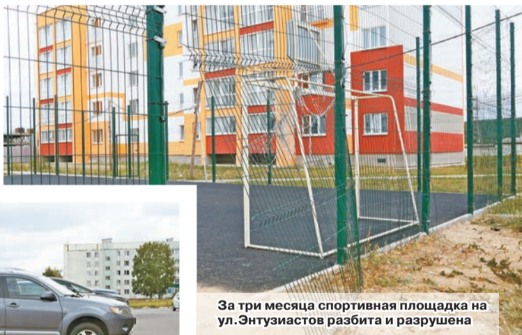
За три месяца спортивная площадка на ул.Энтузиастов разбита и разрушена

ники Шкловского УКП «Жилкомхоз», а вместе с этим специалисты разъяснят жильцам, насколько прочно стоит пятиэтажный дом на улице.