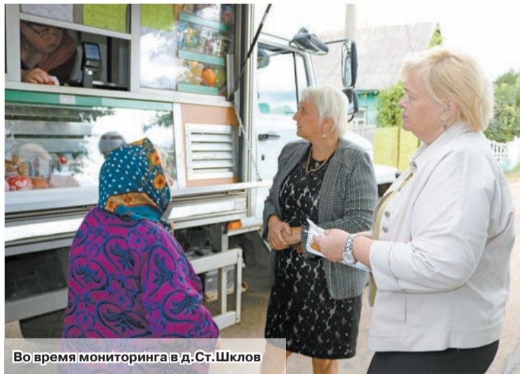
Во время мониторинга в д.Ст.Шклов

Первым объектом рейда стал магазин №135 Шкловского райпо. Магазин современно оборудован, пользуется популярностью у местного населения. Ассортиментный перечень здесь разнообразный: от продуктов питания до товаров первой необходимости, посуды. Но на момент мониторинга в продаже отсутствовал чай. Перечень социально значимых товаров включает 29 позиций: сахар, хлеб, молочная продукция, растительное масло, сыры и т.д. Все