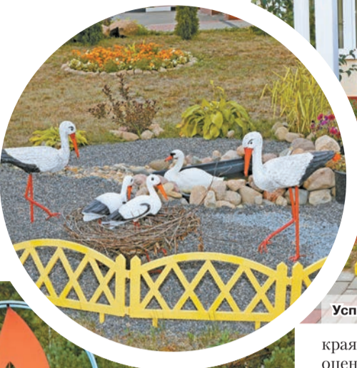
Успех Шкловского РГС – заслуга всего большого и дружного коллектива