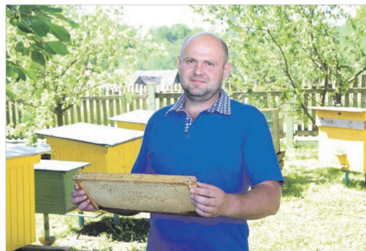
Полосу подготовили Ольга ДАНИЛОВА, Наталья КАЗЕБРОДСКАЯ.

Жители Большого Межника уверены: совместными усилиями они сделают многое.