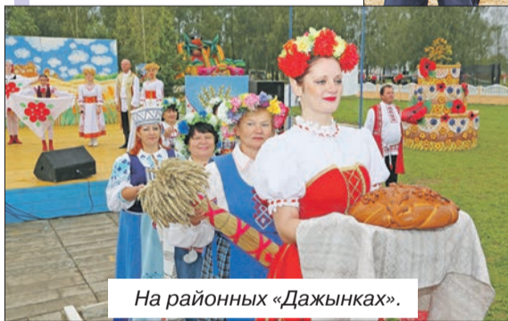
На районных «Дажынках».

■ К концу декабря стало известно, что ОАО «Шкловский агросервис» возобновляет производственно-техническое обслуживание сельхозпредприятий. Основную деятельность акционерное общество ведет в нашем районе. Но спектр услуг делового сотрудничества распространяется на Круглянский и Бельничский районы.