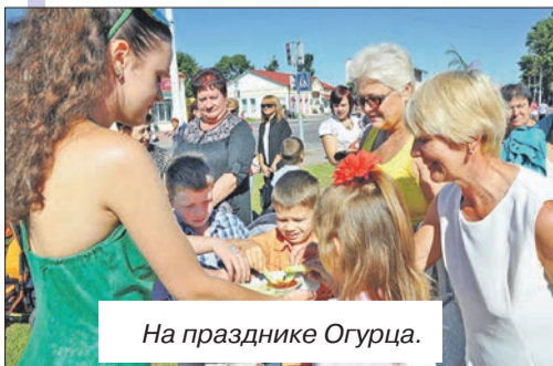
На празднике Огурца.