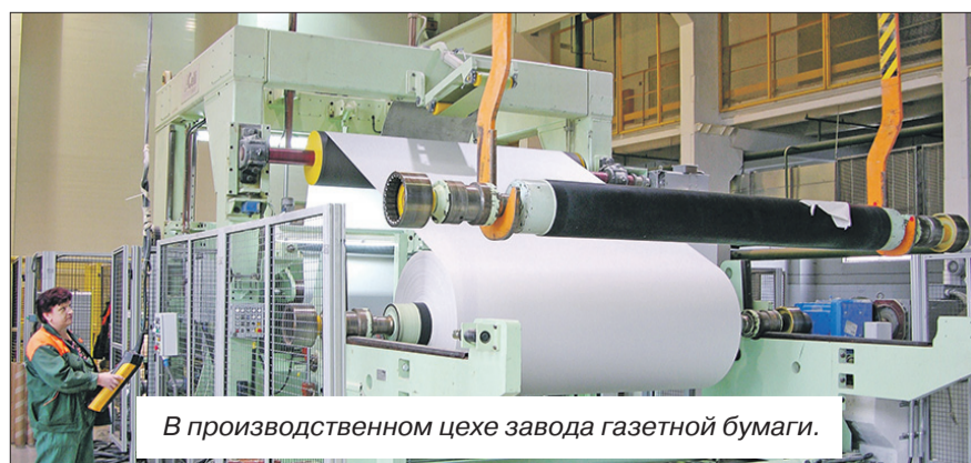
В производственном цехе завода газетной бумаги.