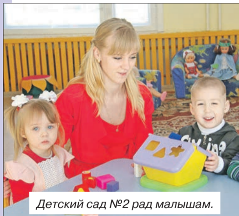
Детский сад №2 рад малышам.

■ В марте был сделан еще один шаг к современному и качественному оказанию медицинской помощи населению. В Шкловской центральной районной больнице после капитального ремонта было открыто отделение анестезиологии и реанимации.