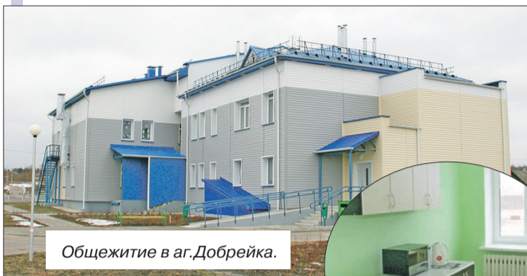
Общезитие в аг.Добрейка.

■ В начале ушедшего года жилищный вопрос для специалистов СП «Газовик-Сипаково» был решен открытием нового комфортного общежития в аг.Добрейка. В нем – 8 комнат на 20 койко-мест. Причем каждая оснащена мебелью и бытовой техникой. Финансирование работ осуществляло РУП «Могилевоблгаз».