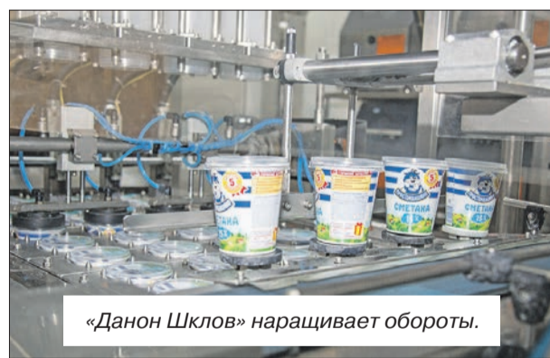
«Данон Шклов» наращивает обороты.

■ Также в минувшем году РУП «Завод газетной бумаги» начал поставлять свою продукцию в 5 новых стран: Бангладеш, Кению, ЮАР и Шри-Ланку.