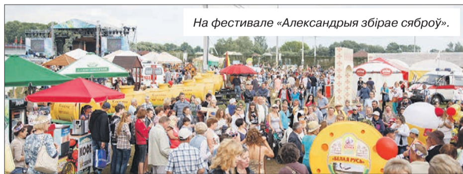
На фестивале «Александрья збірае сяброў».

■ По давно сложившейся традиции аг.Александрия 9-10 июля вновь стал площадкой, на которой в седьмой раз прошел фестиваль «Александрья збірае сяброў». В минувший год праздник посетили более