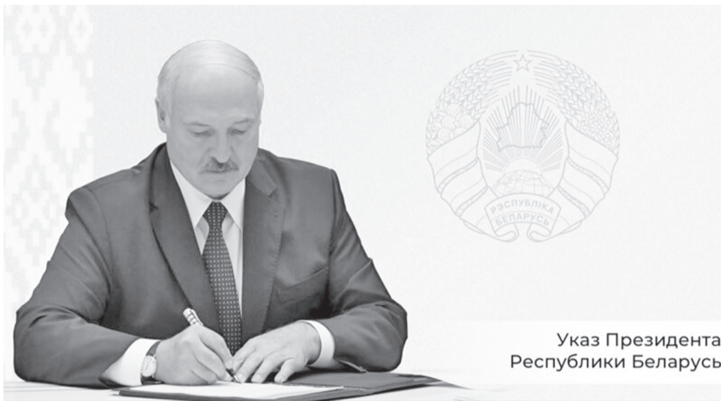
Указ Президента Республики Беларусь