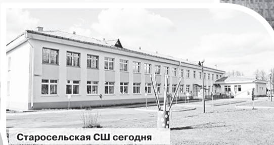
Старосельская СШ сегодня

Старая школа была построена в 1930 году. В строительстве принимали участие лучшие плотники и столяры деревни. Школа работала в две смены. Дети ходили в школу пешком из окрестных деревень, а в сильные морозы и метели оставались в школьном интернате. На большой перемене все бежали в столовую, которая находилась в здании мастерской, пить