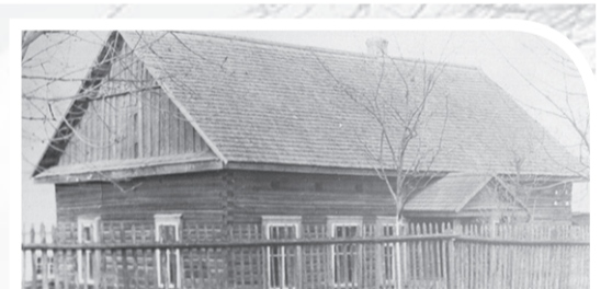
Старая школа, как старая мама, навеки по жизни с тобой. И где бы ты ни был, вдали или рядом, повсюду нас тянет домой.