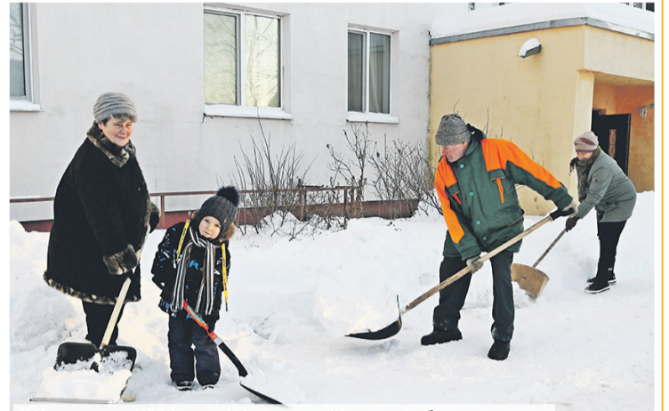
Жители дома №4 на ул. Молодежной дружно убирают снег

Погодные условия вносят свои коррективы в повседневную жизнь граждан. Нынешняя зима выдалась снежной. За несколько дней выпала месячная норма осадков. Коммунальные и дорожные службы, сельхозорганизации и КФХ работают на расчистке снега в усиленном режиме, но территория города и района немаленькая, поэтому на помощь специалистам приходят граждане. Они помогают убирать снег возле своих подъездов, на парковочных стоянках, тротуарных дорожках. Мы побывали на одном из отдаленных микрорайонов города – улице Молодежной, где жильцы дома №4 чистили снег возле подъездов своего дома и на тротуарных дорожках.