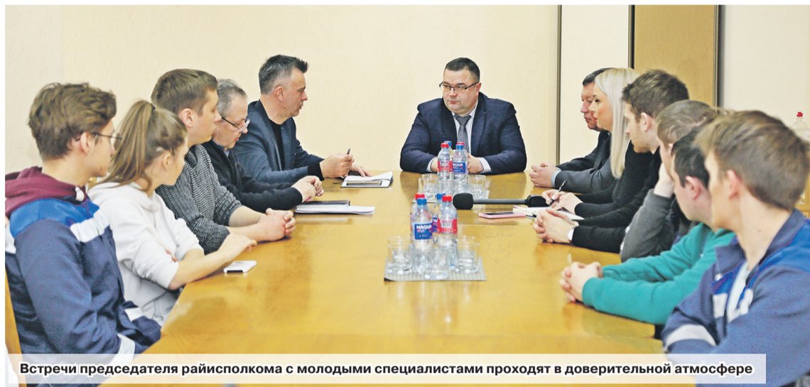
Встречи председателя райисполкома с молодыми специалистами проходят в доверительной атмосфере

Молодой специалист... тот, кто со вчерашней студенческой скамьи становится частью большого трудового коллектива. Новые задачи, обязанности, хлопоты – и в этом круговороте важны помощь и поддержка. Очередной доверительный диалог между руководством района и молодыми специалистами прошел на заводе газетной бумаги.