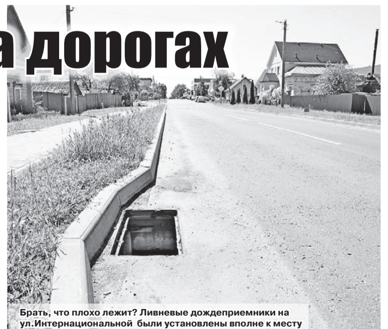
Брать, что плохо лежит? Ливневые дождеприемники на ул. Интернациональной были установлены вполне к месту

Елена МИНАКОВА minakova_alyona@mail.ru