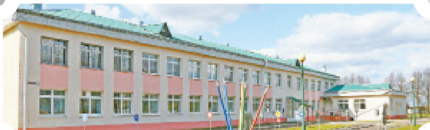
Сегодня учащихся встречает комфортное и современное здание

Алеся Мартинкова. В современном просторном здании обучаются 77 учащихся, 28 воспитанников посещают детский сад. В творческом и профессиональном коллективе работают 24 педагога, многие из которых выпускники школы. Профильная группа аграрной направленности готовит учащихся к поступлению в учебные заведения сельскохозяйственного профиля, достижения юных спортсменов известны далеко за пределами района. Огромное внимание уделяется гражданско-патриотическому воспитанию. Ребята ходят в походы, посещают памятные места, заботятся о воинских захоронениях. Ежегодно проходит научно-практическая конференция «Знай и люби свой край», развивается краеведение.