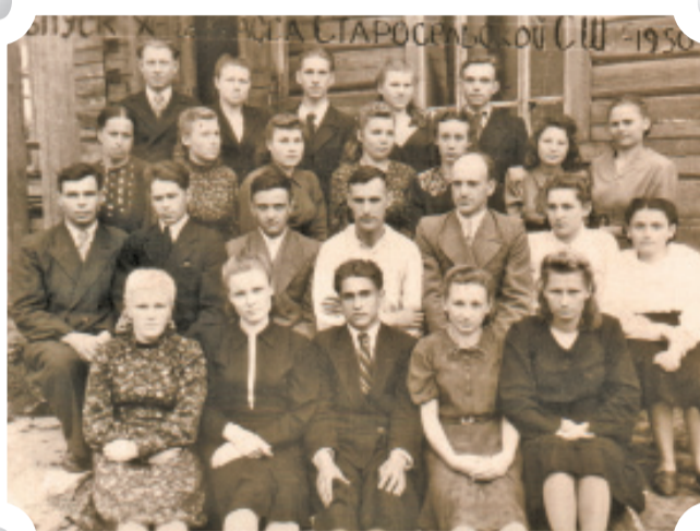
Выпуск 10-го класса в 1950-м