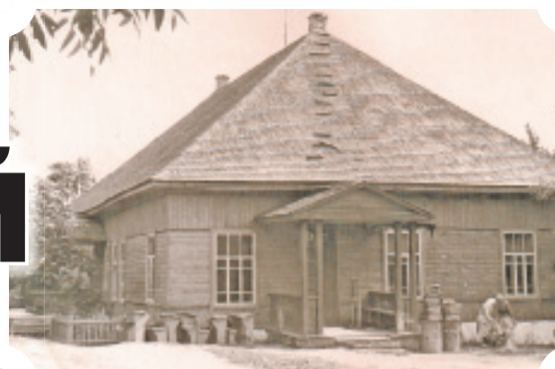
Такой Старосельская школа была в 30-х годах