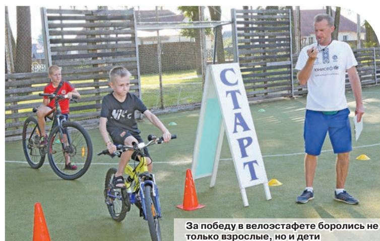
За победу в велоэстафете боролись не только взрослые, но и дети

Было в парке чем заняться и маленьким шкловчанам. Их вниманию представлен интересный спектакль кукольного кружка «Буслыня», игры, конкурсы. Также все желающие смогли испытать удачу в беспроигрышной лотерее, приобрести на память о празднике сувенир либо игрушку на выставке-продаже, попробовать вкусные лакомства в виде попкорна и сладкой воздушной ваты.