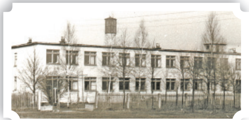
Новая школа приняла детей в 1970-м

В 1937 году неполная средняя школа реорганизована в развивающуюся среднюю школу. С 1941 по 1944 год здесь располагалась немецкая комендатура. Немецко-фашистские оккупанты полностью уничтожили три школьных здания, все оборудование.