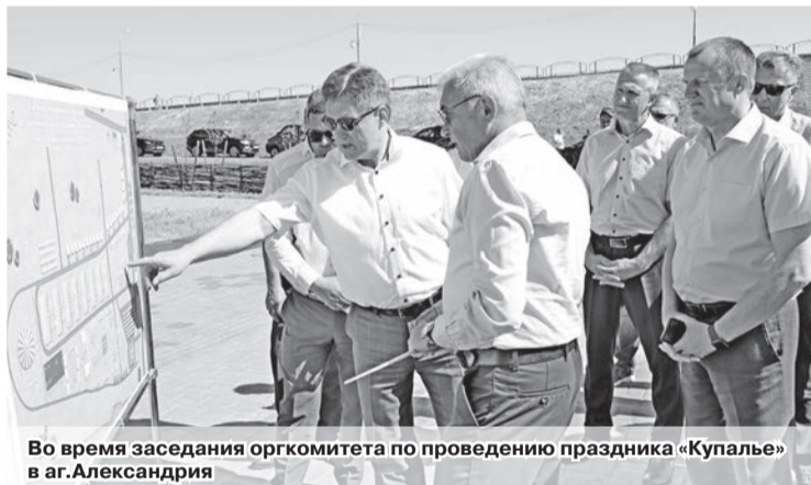
Во время заседания оргкомитета по проведению праздника «Купалье» в аг. Александрия

Как отметил заместитель председателя Могилев-