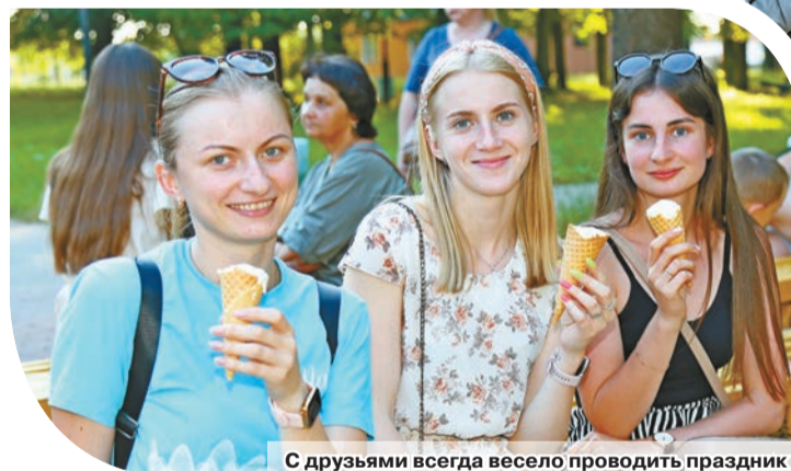
С друзьями всегда весело проводить праздник

Кульминацией праздника стало открытие танцевальной площадки. Это было радостным событием не только для юношей и девушек, но и для тех, кто всегда молод душой. Музыка, улыбки