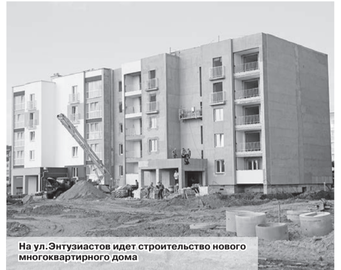
На ул. Энтузиастов идет строительство нового многоквартирного дома

Город Шклов растет и развивается. Еще три десятка лет назад нынешняя улица Энтузиастов представляла собой поле, заросшее травой. Сегодня это целый микрорайон. Многоэтажные дома, детские площадки, спортивные тренажеры и магазины, безусловно, делают жизнь более удобной и комфортной. Но, как известно, совершенству нет предела. Что думают местные жители о возможности благоустройства этой территории и что в реальных планах местной власти?