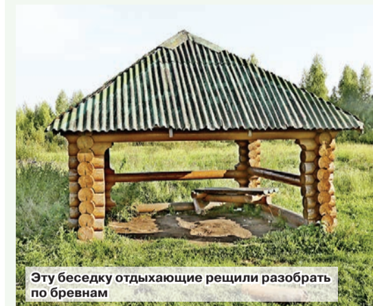
Эту беседку отдыхающие решили разобрать по бревнам

«Серебряный», по традиции верующие окунаются в прорубь.