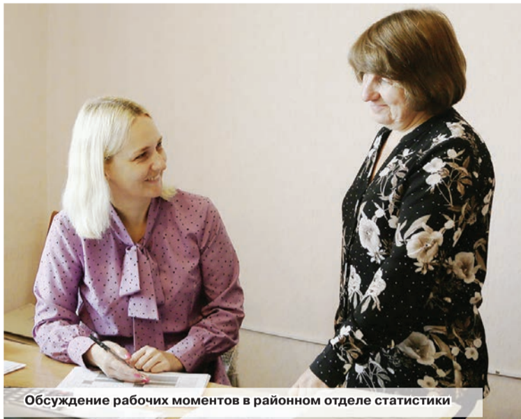
Обсуждение рабочих моментов в районном отделе статистики

В дальнейшем достоверная и независимая статистика служит основой для принятия правильных политических решений, предоставляет адекватную оценку ключевых экономических и социальных показателей, охватывающих все аспекты развития государства. Именно