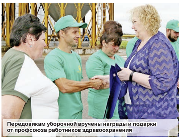
Передовикам уборочной вручены награды и подарки от профсоюза работников здравоохранения