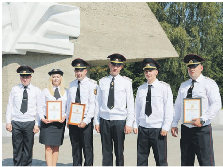
Коллектив ИУОТ №49 на торжественном мероприятии