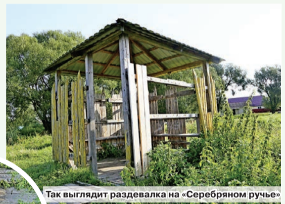
Так выглядит раздевалка на «Серебряном ручье»

Несколько лет назад работниками жилищно-коммунального хозяйства проведена работа по установке новых беседок. Постоянно во время районного и республиканского субботников, акции «Чистый водоем» здесь наводится порядок: убирается вся территория от мусора, оставленного после некоторых отдыхающих, беседки, скамейки покрываются свежей краской и так далее. Зимой в праздник Крещение Господне проходит освящение воды в источнике