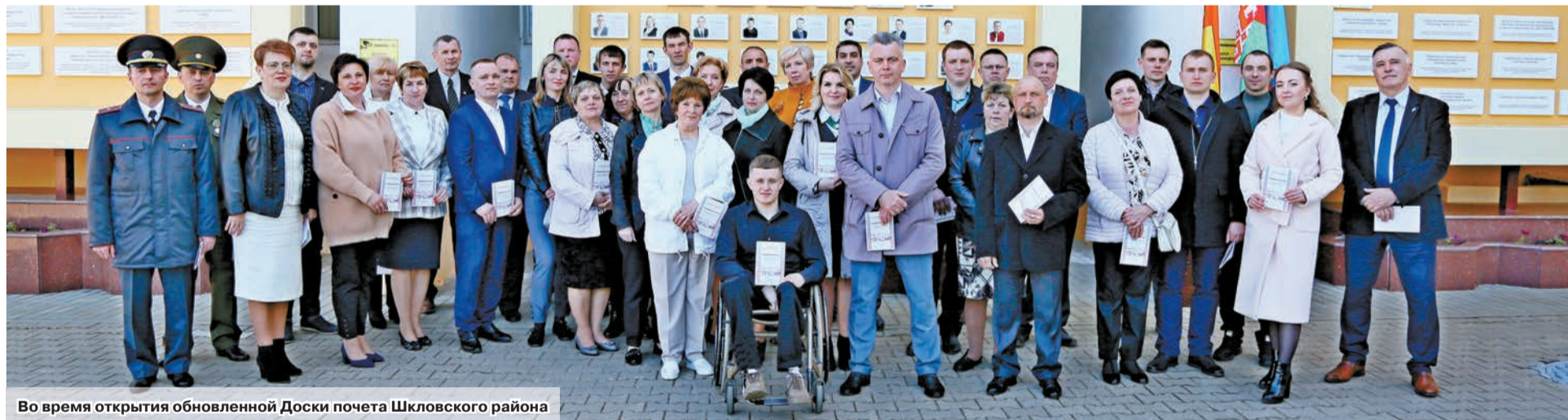
Во время открытия обновленной Доски почета Шкловского района

– На торжественном мероприятии я была в числе награжденных специальной премией облисполкома в социальной сфере. Моя основная задача как педагога воспитать гражданина-патриота, любящего свою родину. Поэтому мы вместе с ребятами из отряда «Патриот» изучаем историю родного края, возрождение традиций белорусского народа. Очень почетно и волнительно было получить награду облисполкома. Спасибо за высокую оценку моего труда.