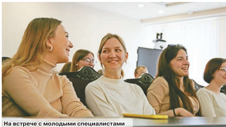
На встрече с молодыми специалистами

Интересовались они и вопросами благоустройства. Ведь комфорт небольших городов тесно взаимосвязан с решением молодых специалистов оставаться