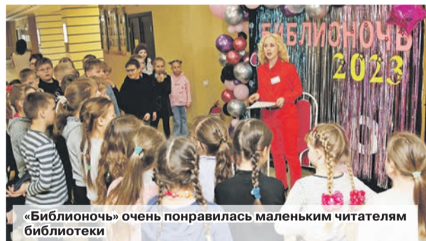
«Библионочь» очень понравилась маленьким читателям библиотеки