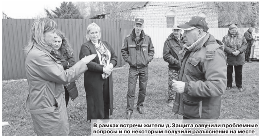
В рамках встречи жители д.Защита озвучили проблемные вопросы и по некоторым получили разъяснения на месте

В ходе встречи местное население активно включилось в диалог. Были озвучены проблемные вопросы, касающиеся качества дороги в д.Защита, тре-