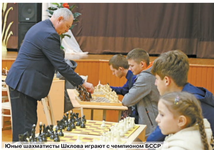
Юные шахматисты Шклова играют с чемпионом БССР

Почетный гость провел для ребят своеобразную лекцию, где разобрал некоторые моменты игры, объяснил, как избежать досадных ошибок в партиях. А после даже показал мастер-класс, проведя сеанс одновременной игры. К слову, среди участников встречи – ребята разных возрастов и опытом участия в соревнованиях.