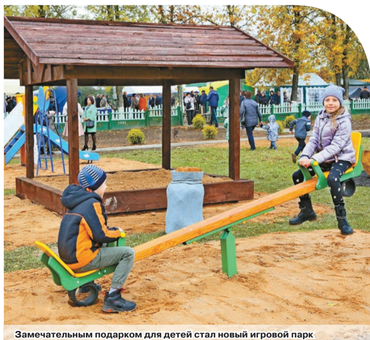
Замечательным подарком для детей стал новый игровой парк