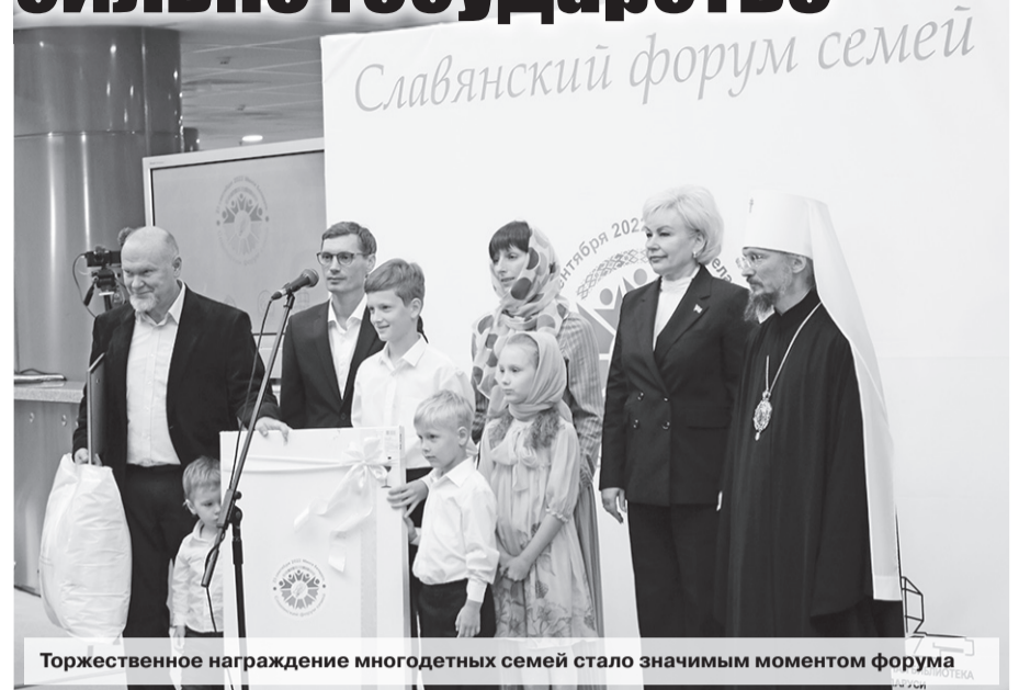
Торжественное награждение многолетних семей стало значимым моментом форума

Традиционная семья как союз мужчины и женщины, многодетность, воспитание детей на основе уважения к старшим, любви и духовности в противовес однополым бракам, чайлдфри и абортмам... Именно это является основой развития общества и государства и именно об этом говорилось на «Славянском форуме семей», который прошел 23 сентября в Минске на базе Национальной библиотеки. Организаторами его выступили Белорусская православная церковь, Благотворительный фонд поддержки семьи, материнства и детства «Покров» при поддержке Министерства труда и социальной защиты.