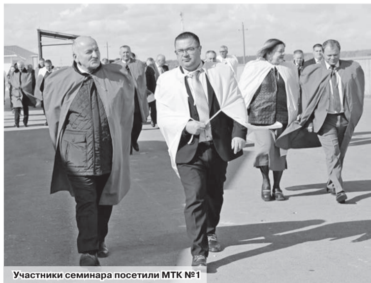
Участники семинара посетили МТК №1

Начался выездной семинар с расстановки акцентов. Губернатор заслушал отдельных пред-