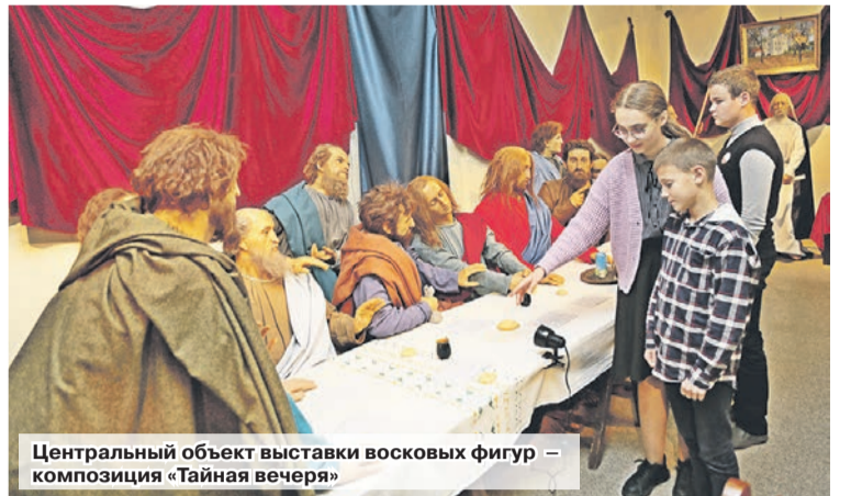
Центральный объект выставки восковых фигур – композиция «Тайная вечеря»

В быстротечном 21 веке, веке электронных гаджетов и всемирной паутины, очень важно помнить о том, что сохранилось от наших прадедов. О тех моральных ценностях, которые формировались веками и во главе ставили торжество добра и любви. И очень важно рассказывать об этом подрастающему поколению, как делают в районном историко-краеведческом музее на занятиях «Православное воспитание – традиция и семья».