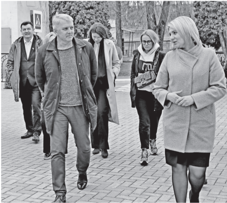
Делегацию Российской Федерации встречали и в Александровской СШ

Начало апреля ознаменовалось для Могилевской области визитом российской делегации Министерства спорта. Вопросы взаимодействия двух стран в сфере физкультуры и спорта стали темой обсуждения министров спорта Беларуси и Российской Федерации. А результатом стало расширение сотрудничества между регионами. Подписанные документы по итогам совместного заседания коллегий министерства спорта РФ и министерства спорта и туризма РБ предполагают увеличение числа совместных спортивных мероприятий, организацию учебно-тренировочных сборов, а также развитие студенческого спорта и регионального сотрудничества.