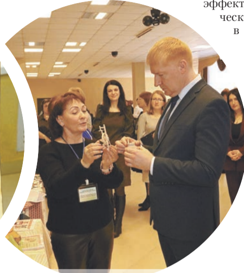
Во время проведения II районного фестиваля педагогических идей и достижений «На крыльях творчества»

Состоялась и презентация работы партнерской сети района по патриотическому и гражданскому воспитанию. Затем педагоги со стажем и их молодые коллеги поделились своим опытом, инновационными идеями и достижениями. Участники фестиваля были не только слушателями, но и активными участниками мастер-классов.