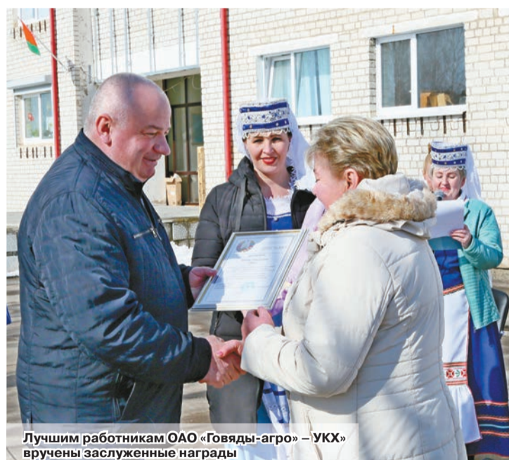
Лучшим работником ОАО «Говяды-агро» – УКХ» вручены заслуженные награды

«Темп роста объемов производства продукции в минувшем году составил 105,1%. Произведено 15950 тонн молока, или 105,6%. Продуктивность коров – 6129 килограммов. Производство и выращивание КРС – 880 тонн, или 92,9%. Получено 2084 головы приплода. Производство продукции растениеводства составило 109%. Валовой сбор зерна – 8408 тонн», – отметил Виталий Григорьевич и назвал имена лучших тружеников в каждом виде работ.