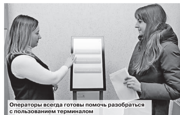
Операторы всегда готовы помочь разобраться с использованием терминалом

«Кто крайний? Я за вами буду...» Эти слова все реже и реже можно услышать в различных учреждениях. В банковской системе электронная очередь дело давнее и привычное. И вот сейчас пришло время почты. Вслед за областным центром электронная очередь приходит в районы. С конца января она действует в Шклове на ОПС-4.