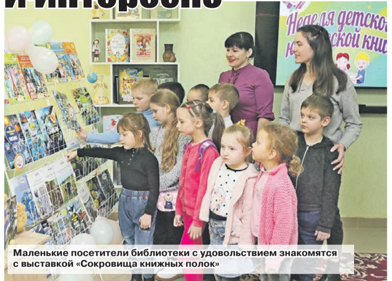
Маленькие посетители библиотеки с удовольствием знакомятся с выставкой «Сокровища книжных полок»

Каникулы – это время, которое можно провести не только интересно, но и с пользой. Именно поэтому районная библиотека подготовила для ребят множество интересных и увлекательных мероприятий в рамках Недели детской и юношеской книги. А началась она с мероприятия «Нынче праздник чтения – всем на загляденье». Для детей было показано театрализованное представление, а Королева-книга наградила самых активных и самых маленьких читателей.