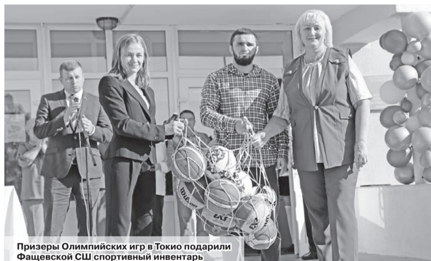
Призеры Олимпийских игр в Токио подарили Фацевской СШ спортивный инвентарь

Ольга ДАНИЛОВА assol2711@mail.ru