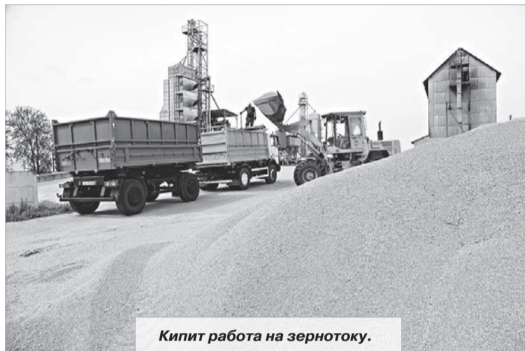
Кипит работа на зерноток.

Идеальная уборочная – это жаркие дни без дождей, которые позволяют убирать сухое зерно. Но запретить дождям идти нельзя. А урожай должен быть убран вовремя независимо от погодных условий. Поэтому на помощь аграриям приходят зерносушильные комплексы.