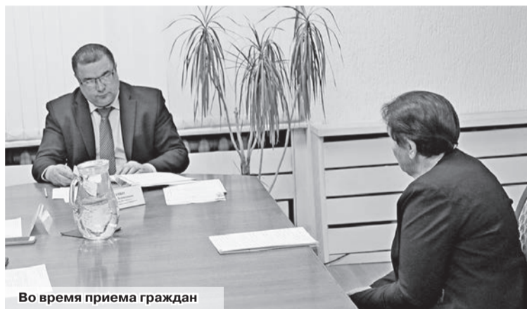
Во время приема граждан

Супружескую пару из деревни Слободки на прием к председа-