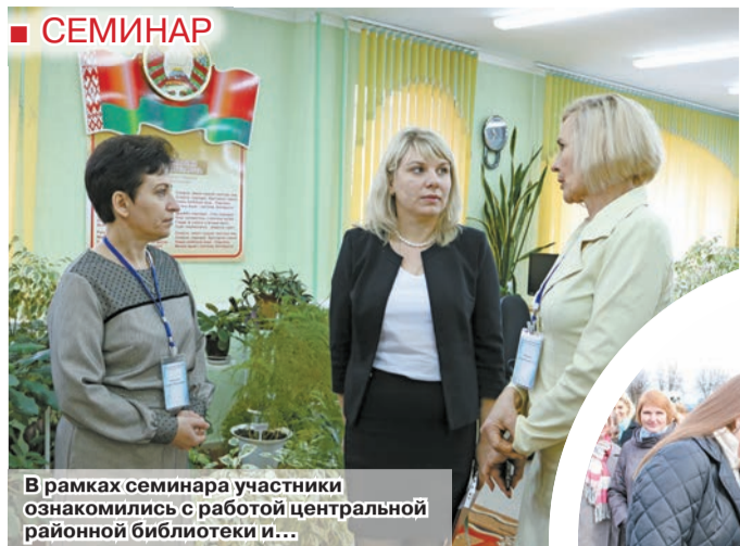
В рамках семинара участники ознакомились с работой центральной районной библиотеки и...

Одна из главных задач библиотек – сохранить для потомков все то, что составляет гордость родного края, помогает понять значение и роль своей малой родины в истории и культуре Беларуси. Библиотечное краеведение в сохранении и продвижении историко-культурного наследия региона стало главной темой республиканского семинара, который прошел в Шклове 27 октября для специалистов библиотечного дела.