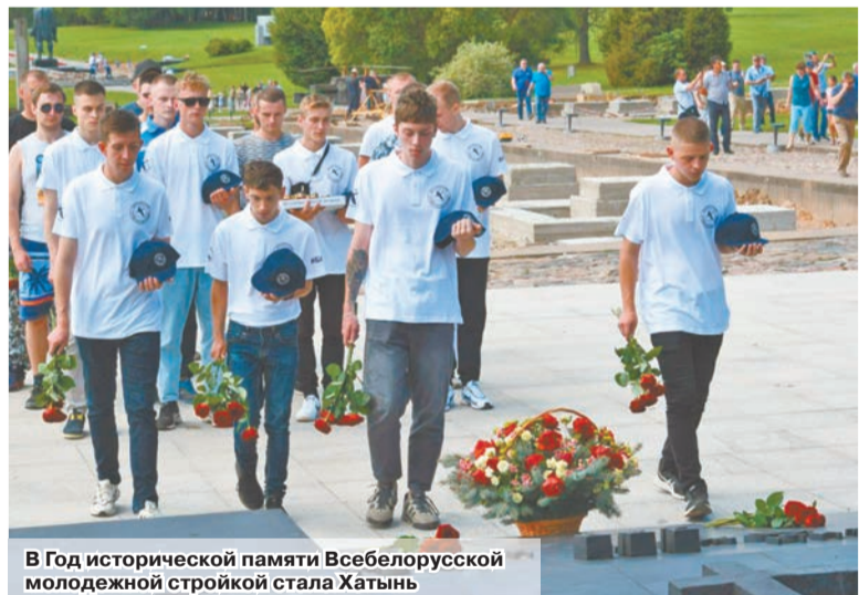
В Год исторической памяти Всебелорусской молодежной стройкой стала Хатынь

Романтика, совместная работа, неповторимая дружеская атмосфера... Все это – студенческие отряды. Их история тянется с советских времен, когда комсомольцы осваивали целину и строили БАМ. В наше время молодежь проявляет себя в делах ничуть не менее почетных.