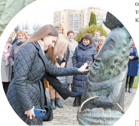
...побывали у памятника огурцу, где узнали про народные поверья, связанные с ним

историко-культурного наследия, познакомили присутствующих с онлайн-энциклопедией «Беларусь у асобах і падзеях», разработанной в Национальной библиотеке, цифровым наследием библиотек Могилевской области, деятельностью библиотек Дрибинского и Краснопольского районов в сохранении исторической памяти и народных традиций. Шкловчане поделились опытом по созданию веб-ресурсов в разных направлениях краеведческой деятельности и их продвижению, рассказали о работе библиотеки в аг.Евдокимовичи и любительского объединения «Флориада» центральной рай-