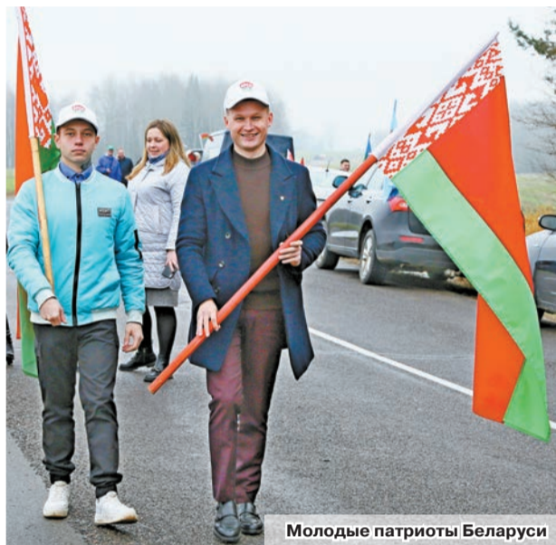
Молодые патриоты Беларуси

Наталья КАЗЕБРОДСКАЯ natali.ya1988@mail.ru