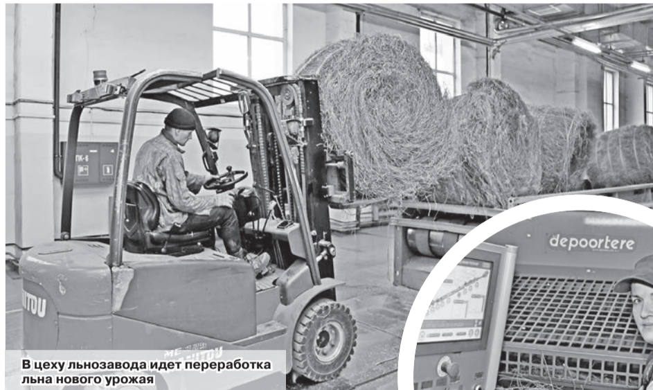
В цеху льнозавода идет переработка льна нового урожая

Пока на полях завершаются последние сельхозработы, льноводы подводят итоги сезона. Для ОАО «Шкловский льнозавод» он сложился как никогда успешно. 9200 тонн льнотресты – это на 4000 больше, чем в прошлом году, то есть практически вдвое.