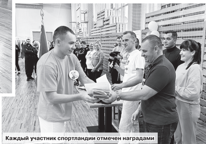
Каждый участник спортландии отмечен наградами

В ОАО «Александрийское» спорт и труд рядом идут. Стать еще дружнее, провести с пользой время и укрепить здоровье смогли работники на прошедшей неделе. В минувшую субботу на базе универсального спортивного центра «Александрия» прошла ежегодная спортландия между структурными подразделениями сельхозпредприятия.