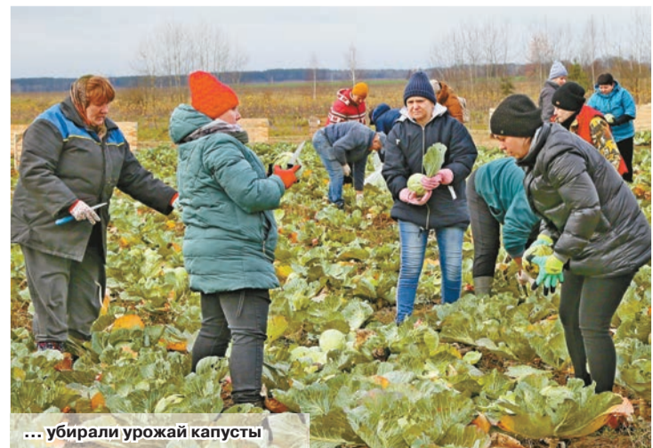
... убирали урожай капусты

Наталья КАЗЕБРОДСКАЯ natali.ya1988@mail.ru