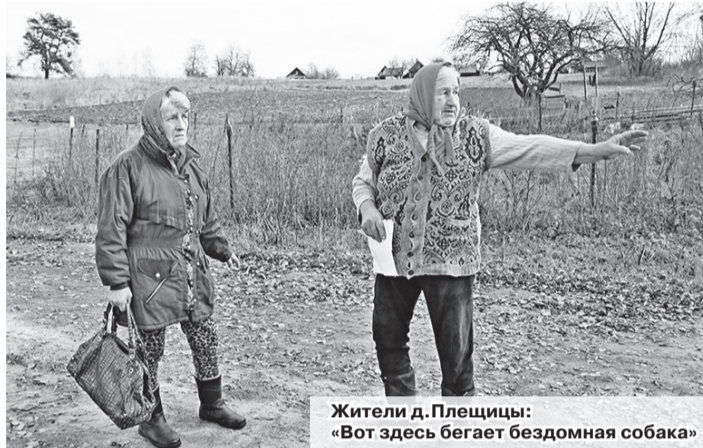
Жители д. Плещицы: «Вот здесь бегают бездомная собака»