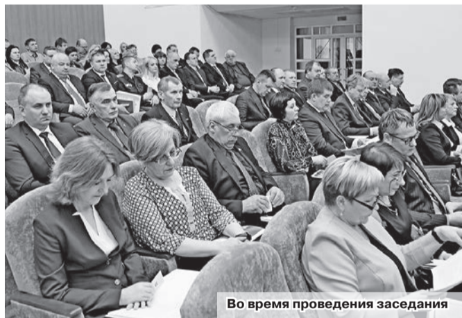
Во время проведения заседания

военно-патриотического воспитания учащихся. Также был озвучен ряд приоритетных направлений деятельности местных Советов депутатов, депутатского корпуса, органов территориального общественного самоуправления, по которым уже наработаны положительные результаты и которые имеют перспективу развития в текущем году, а