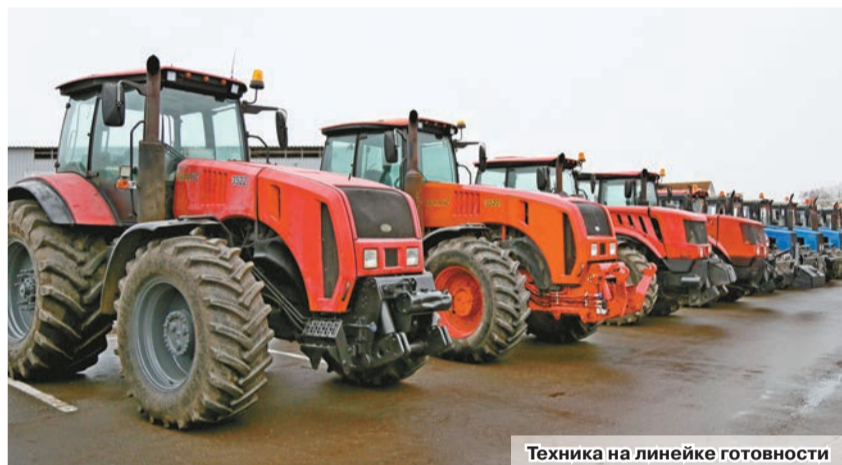
Техника на линейке готовности

Продолжилась коллегия в ОАО «Александрийское», где участники также ознакомились с подготовкой к предстоящей посевной и готовностью техники. Ряд актуальных рабочих вопросов обсудили во время заседания. Были заслушаны руководители структурных подразделений и агропромышленных организаций, входящих в систему Управления делами Президента Республики Беларусь. При подведении итогов акцент был сделан на задачи по обеспечению своевременного и качественного проведения весенне-полевых работ.