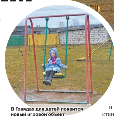
В Говядях для детей появится новый игровой объект

к местной власти, под которым подписались 90 человек. Просьба одна – сделать площадку, где смогут гулять дети. Причем придерживаются этого мнения многие.