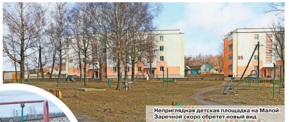
Неприглядная детская площадка на Малой Заречной скоро обретет новый вид

И хотя по плану возвести игровую зону планируется к