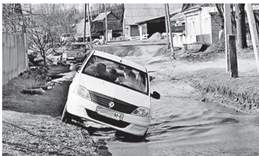
Автомобилисты утверждают, что преодолеть один из «бассейнов» на ул. Вишневой можно только так