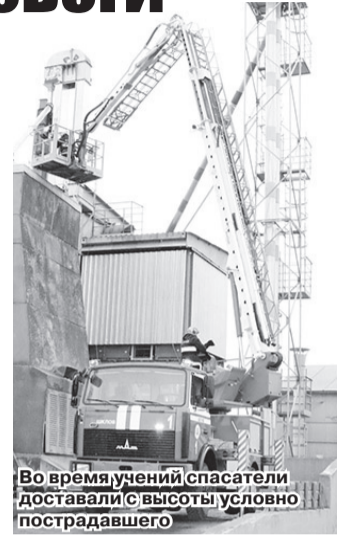
Во время учений спасатели доставали с высоты условно пострадавшего

Ольга ДАНИЛОВА assol2711@mail.ru