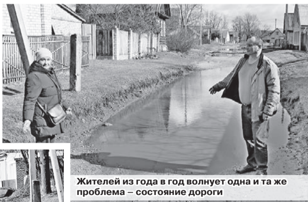
Жителей из года в год волнует одна и та же проблема – состояние дороги

скивал из снежного или грязевого плена таких же автолюбителей, проезжавших по улице Вишневой.