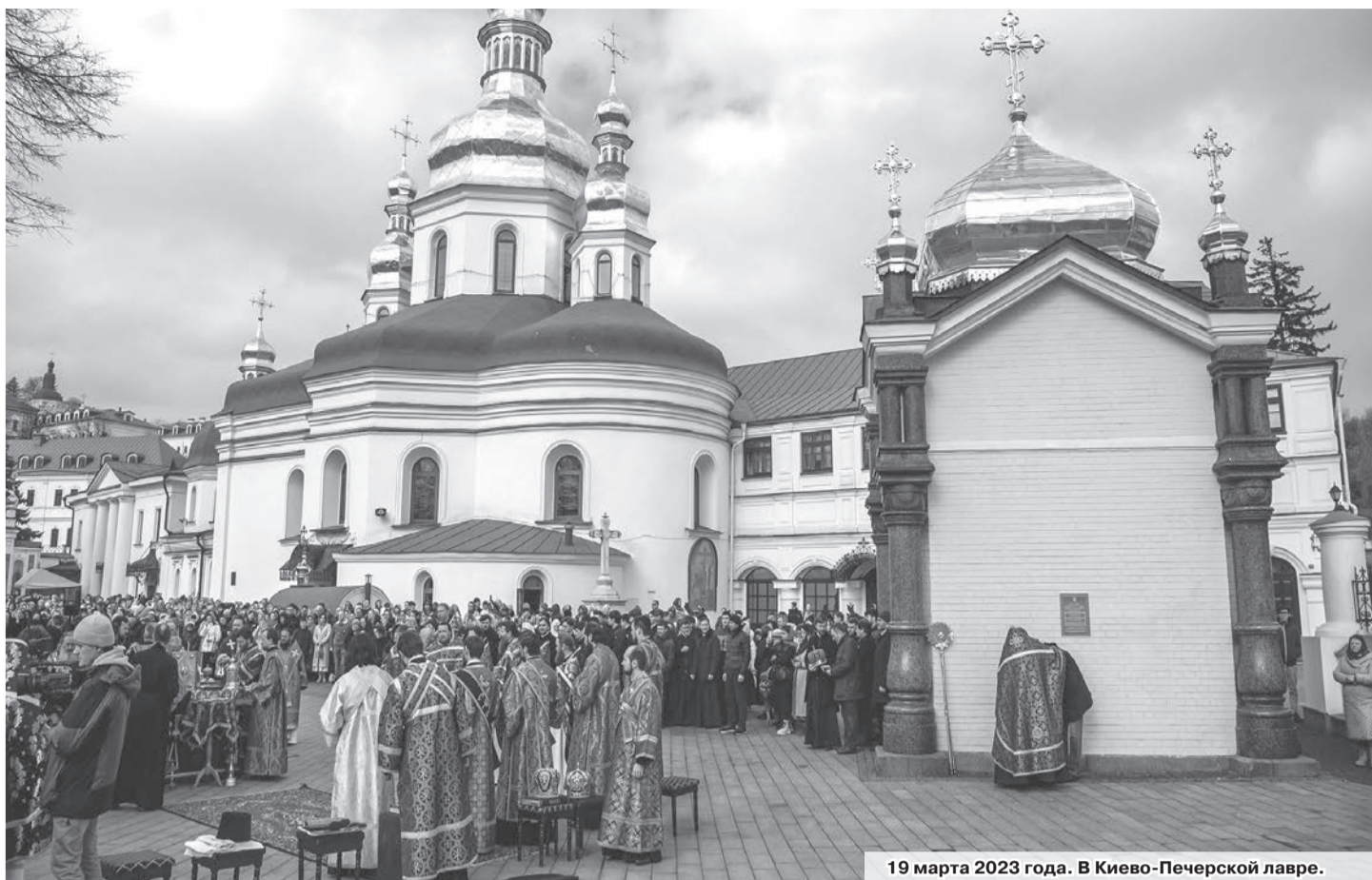
19 марта 2023 года. В Киево-Печерской лавре.