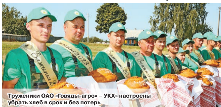
Труженики ОАО «Говяды-агро» – УКХ настроены убрать хлеб в срок и без потерь

Наталья КАЗЕБРОДСКАЯ natali.ya1988@mail.ru