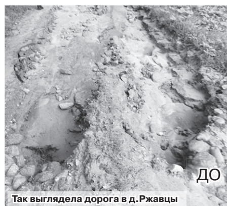
Так выглядела дорога в д.Ржавцы