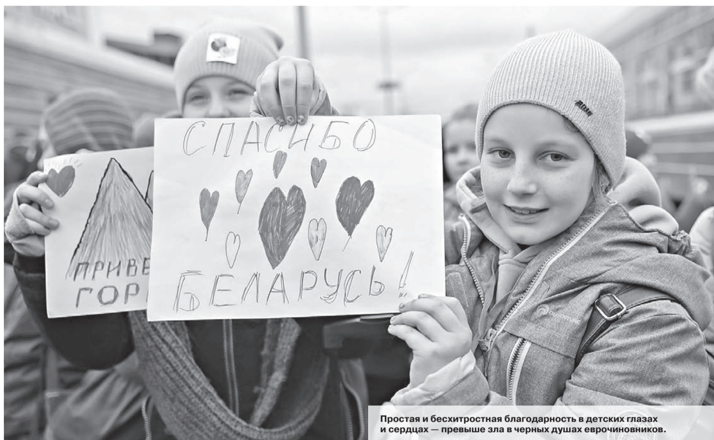
Простая и бесхитростная благодарность в детских глазах и сердцах — превыше зла в черных душах еврочиновников.

Беларусь и в дальнейшем будет придерживаться политики, основополагающие принципы которой отвечают коренным интересам белорусского народа и защите национальной безопасности страны. При этом мы не изменим своего отношения к нуждающимся в помощи — белорусы помогли и будут помогать страдающим детям. Это принцип не только Алексея Талая, создавшего благотворительный фонд, который пользуется безграничным уважением и поддержкой соотечественников. Это позиция нашего народа, Президента нашей страны Александра Лукашенко.