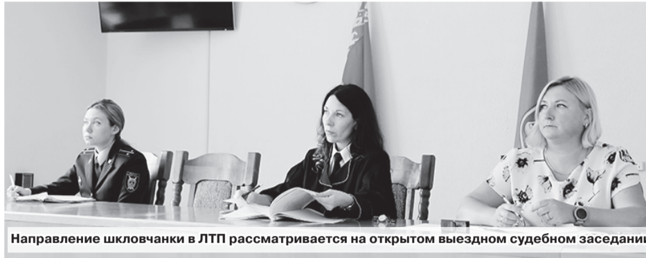
Направление шкловчанки в ЛТП рассматривается на открытом выездном судебном заседании