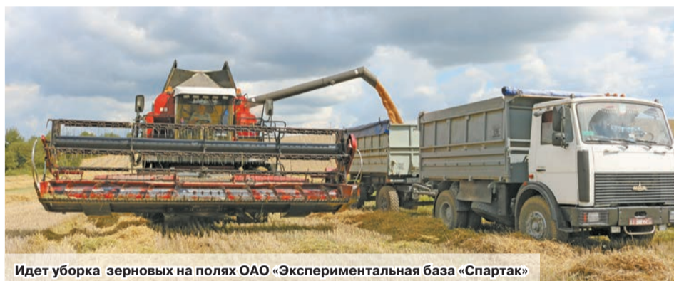
Идет уборка зерновых на полях ОАО «Экспериментальная база «Спартак»