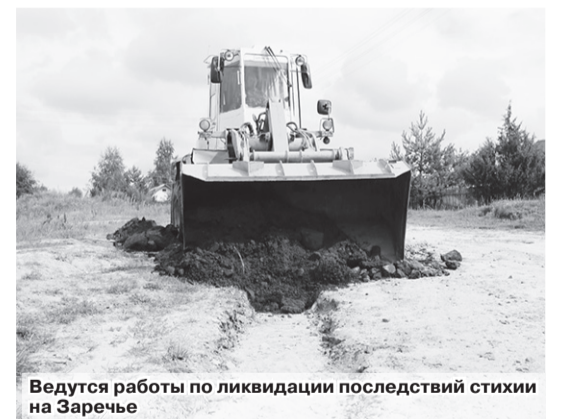
Ведутся работы по ликвидации последствий стихии на Заречье