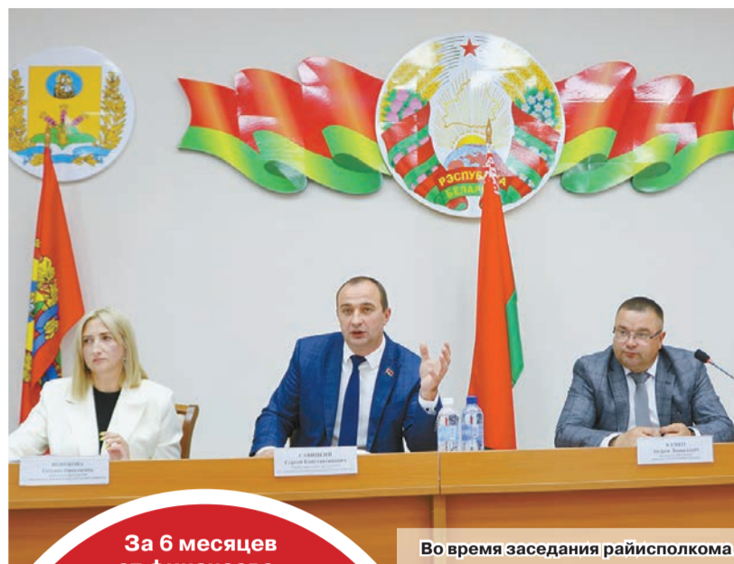
Во время заседания райисполкома

За 6 месяцев от финансово-хозяйственной деятельности по району получена выручка от реализации продукции, товаров, работ и услуг в сумме 292,8 млн рублей. Обеспечен рост чистой прибыли, положительный уровень рентабельности. Количество убыточных организаций сократилось до 6.