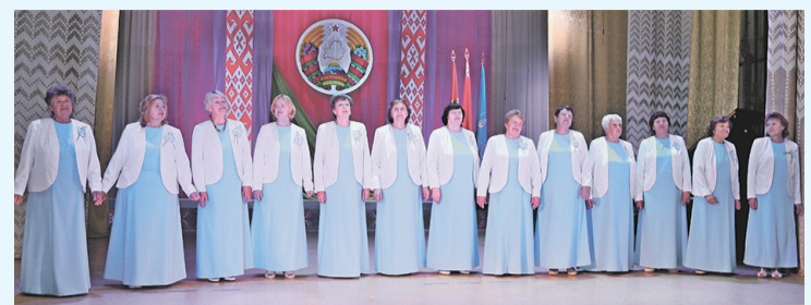
Накануне 1 октября в районном Доме культуры состоялся концерт ко Дню пожилых людей.

Особенно проникновенными на празднике звучали песни в исполнении народного хора ветеранов труда «Мелодия», участники которого являются ярким примером того, что в пожилом возрасте жизнь может быть активной и интересной.