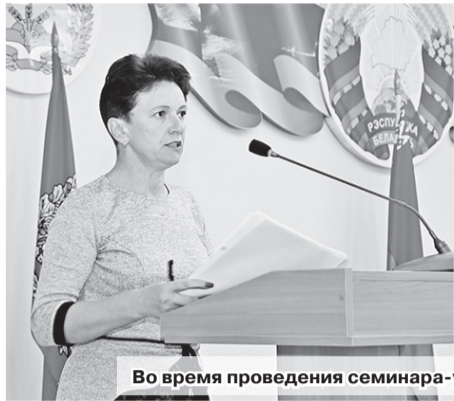
Во время проведения семинара-учебы

Семинар-учеба на тему «Исполнение законодательства об обращениях граждан и юридических лиц» прошел в райисполкоме. В нем приняли участие работники кадровых служб и ответственные за ведение делопроизводства по обращениям граждан и юридических лиц в организациях и на предприятиях.