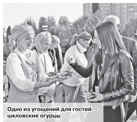
Одно из угощений для гостей – шкловские огурцы

Данное мероприятие проходит шестой год подряд. В этом году честь принимать конкурс выпала Могилевской земле, и общим решением было принято провести его на Шкловщине. На 1 января в Беларуси действовали 3272 молочно-товарные фермы. Их обслуживают 2787 техников по искусственному осеменению. Труд специалистов данного профиля очень сложен. Благодаря ему мы развиваем генетический потенциал животных, улучшаем показатели продуктивности, и, конечно, обеспечиваем продовольственную безопасность страны. В структуре АПК животноводческая продукция занимала 52% за прошлый год, по итогам этого года ожидаем цифру выше. В 2022 году благодаря животноводам, операторам по искусственному осеменению, всем, кто задействован в отрасли животноводства, мы произвели продукции на сумму свыше 16 миллиардов рублей.