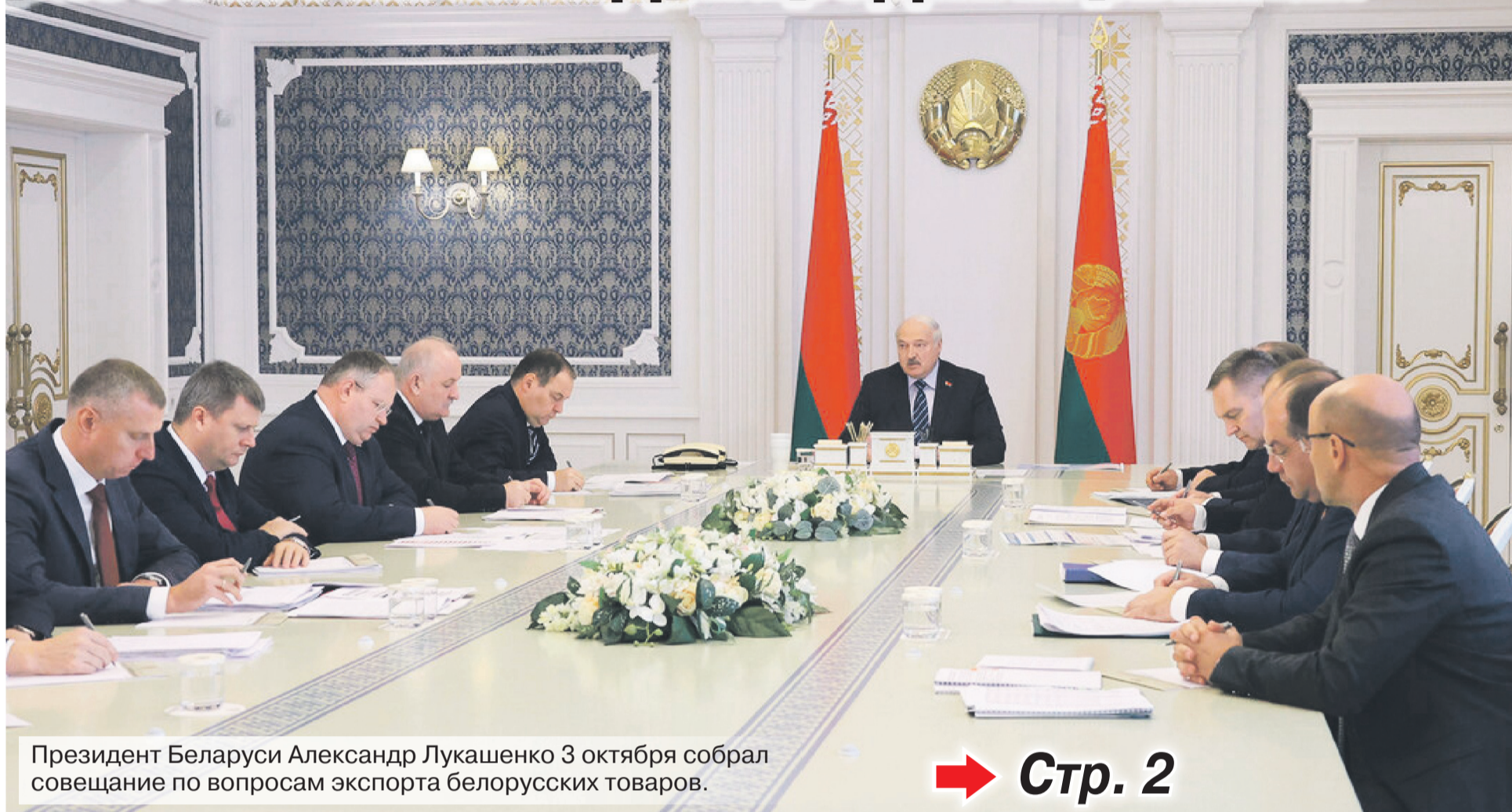
Президент Беларуси Александр Лукашенко 3 октября собрал совещание по вопросам экспорта белорусских товаров.