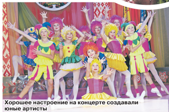
Хорошее настроение на концерте создавали юные артисты