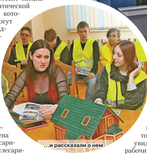
...и рассказали о нем

механики – могут получить специальности в Кричеве, в Могилеве, Бобруйске. «ПМК-2, райпо, льнозавод, колледж, сельхозорганизации района – на наших ярмарках целевой подготовки учащиеся воочию увидели, как происходит рабочий процесс и не исклю-