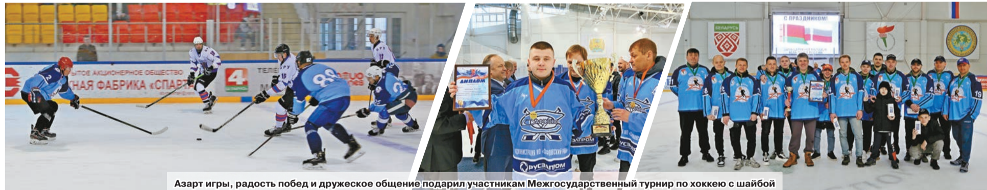
Азарт игры, радость побед и дружеское общение подарил участникам Межгосударственный турнир по хоккею с шайбой

1 и 2 апреля на Ледовой арене г.Шклова было необычайно жарко от накала эмоций и не утихали спортивные страсти. Здесь прошел Межгосударственный турнир по хоккею с шайбой среди любительских команд, посвященный Дню единения народов Беларуси и России. На лед вышли команды из городов Хиславичи, Сафоново (Российская Федерация), Шклов и Могилев (Беларусь).