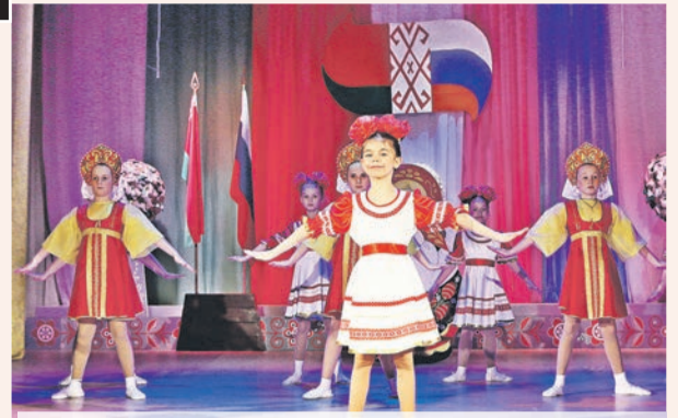
Праздничное настроение на концерте дарят юные артисты

2 апреля в нашей республике отмечался День единения народов Беларуси и России. Именно в этот день в 1996 году президентами двух стран был подписан договор «Об образовании Сообщества России и Беларуси», положивший начало созданию Союзного государства. Накануне значимого праздника прошел тематический концерт, который собрал в районном Доме культуры представители трудовых коллективов, общественности, молодежь.