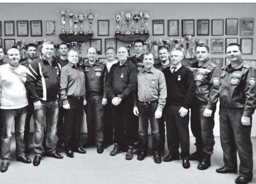
Ветераны и сотрудники районного отдела по чрезвычайным ситуациям.