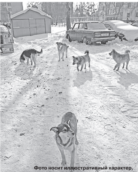
Фото носит иллюстративный характер.

«Для Маши это было шоком. Все, что она смогла – заплакать и закрыть лицо руками», – рассказывает мама девочки (по ее просьбе фамилию не называем). Уже в больнице школьница рассказала, что помог ей проходивший мимо мужчина, который отогнал собаку. Этот случай для нашего района далеко не единственный. Собаки кусали и кусают. В районном Центре гигиены и эпидемиологии сообщили, что в ушедшем году зарегистрировано более 85 случаев нападений животных на человека, из них агрессорами в большинстве случаев были именно собаки. Четвероногие «друзья человека» выбирали на роль своих жертв детей 22 раза. Причем, в 10 из этих случаев собак так и не удалось установить.