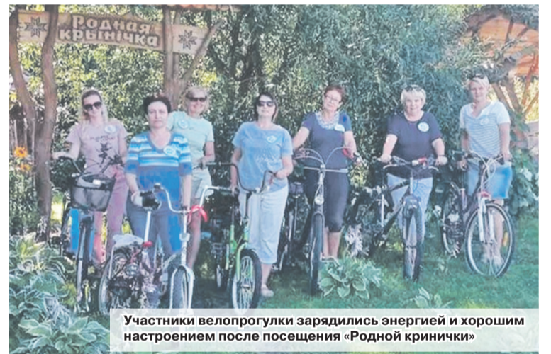
Участники велопогулки зарядились энергией и хорошим настроением после посещения «Родной кринички»

Своеобразная красота родных мест, легенды былых времен, родные люди – вот неиссякаемый источник жизнелюбия, прочная опора в настоящем и уверенность в будущем. Знание о крае, развитие интереса к прошлому – ступенька к дальнейшему осознанию своей Родины, ее истории и культуры.