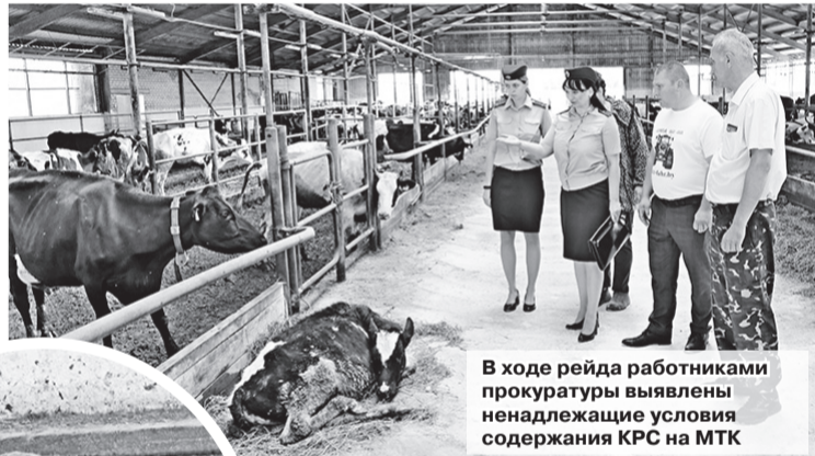
В ходе рейда работниками прокуратуры выявлены ненадлежащие условия содержания КРС на МТК

ЗАО «Польковичское» в прокуратуре находится на особом контроле. В адрес руководства уже не раз выносились акты прокурорского реагирования. Нужно отдать должное — работа здесь проводится, но все же окончательно устранить недостатки пока не получается. Такое же мнение и у старшего прокурора отдела по надзору за исполнением законодательства