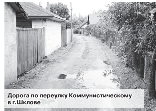
Дорога по переулку Коммунистическому в г. Шклове

За комментариями по поводу данной ситуации мы обратились в УКП «Жилкомхоз» и отдел жилищно-коммунального хозяйства райисполкома. Нам сообщили, что еще в начале года данная дорога обследована, установлено, что по переулку она была отсыпана асфальтной крошкой и находилась в проезжем состоянии, в трех местах имелись провалы. Во втором квартале УКП «Жилкомхоз» выполнены работы по ремонту дороги, ее подсыпка песчано-гравийной смесью. В связи с тем, что улица узкая и отсутствует возможность выполнения профилирования дорожного полотна