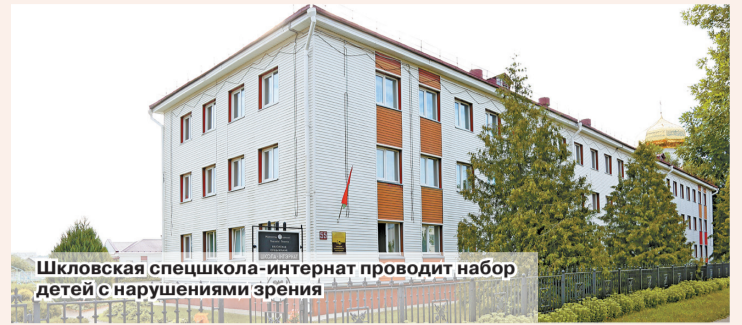
Шкловская спецшкола-интернат проводит набор детей с нарушениями зрения