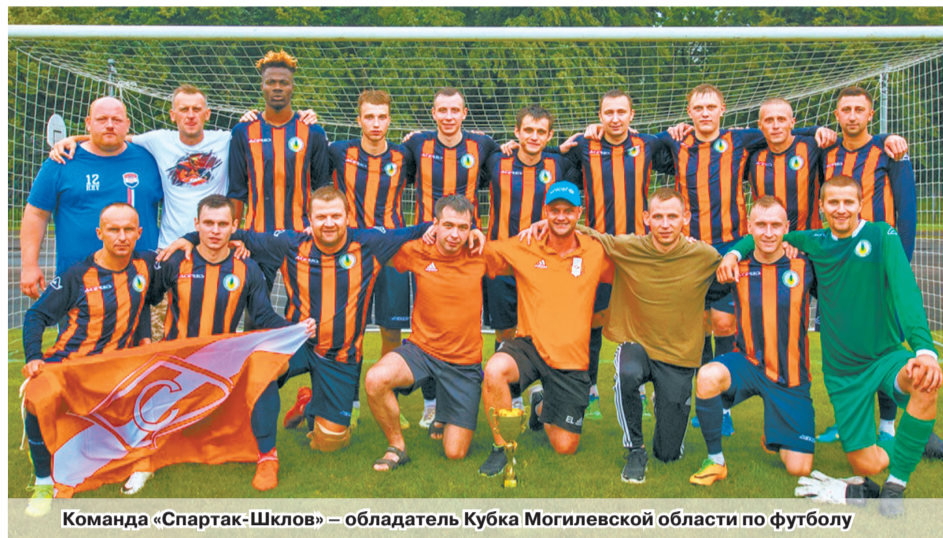
Команда «Спартак-Шклов» – обладатель Кубка Могилевской области по футболу