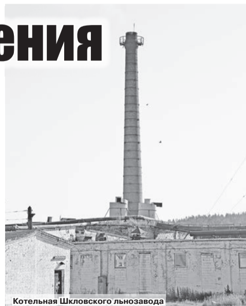
Котельная Шкловского льнозавода