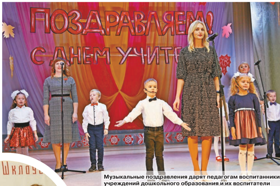
Музыкальные поздравления дарят педагогам воспитанники учреждений дошкольного образования и их воспитатели