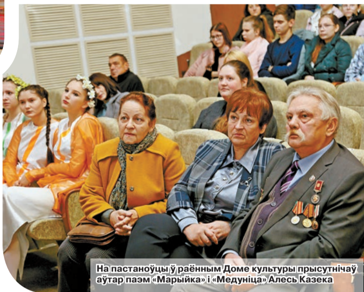
На пастаноўцы ў раённым Доме культуры прысутнічаў аўтар паэм «Марыйка» і «Медуница» Алесь Казека

Па заканчэнні мерапрыемства намеснік начальніка