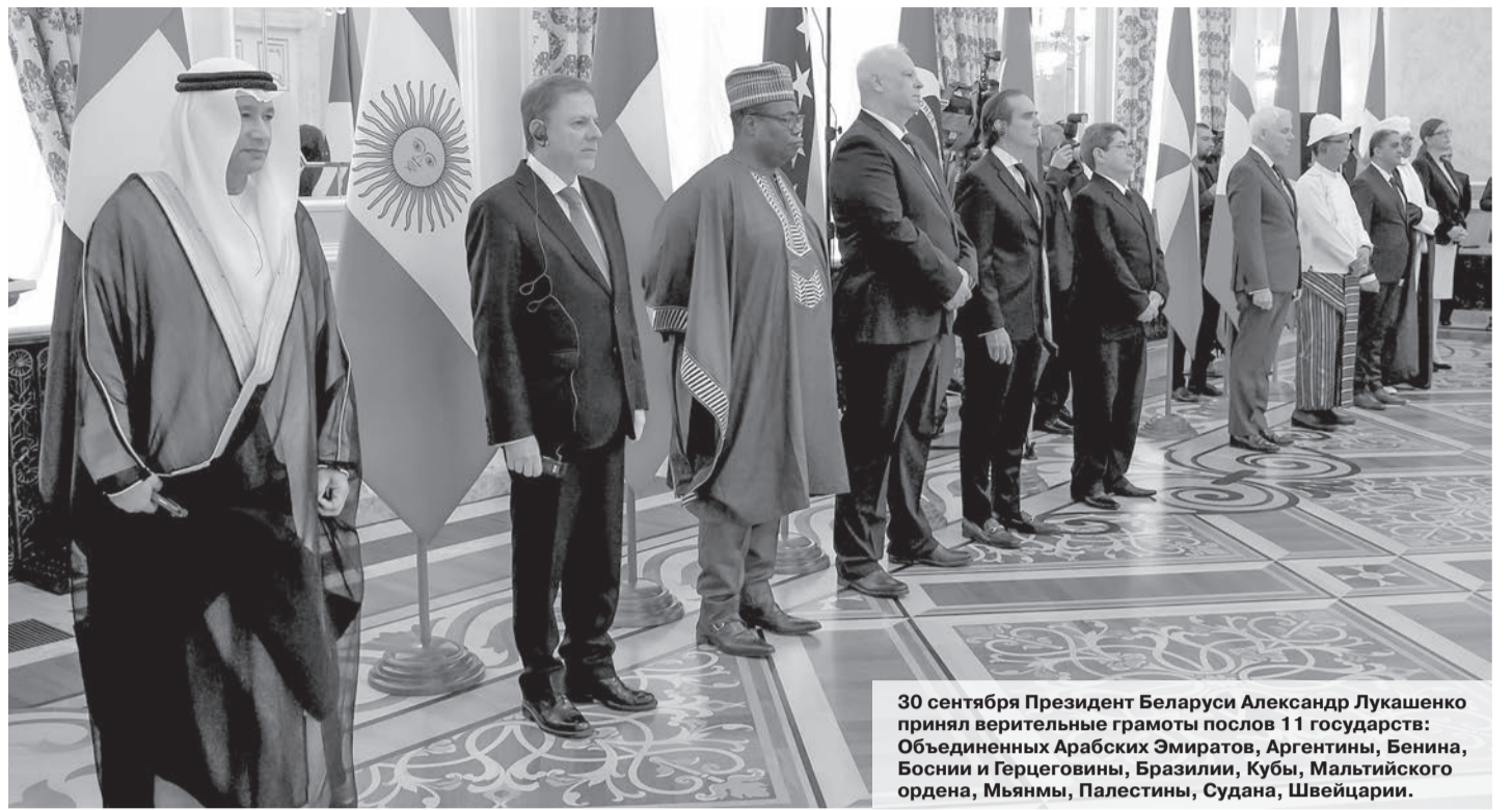
30 сентября Президент Беларуси Александр Лукашенко принял верительные грамоты послов 11 государств: Объединенных Арабских Эмиратов, Аргентины, Бенина, Боснии и Герцеговины, Бразилии, Кубы, Мальтийского ордена, Мьянмы, Палестины, Судана, Швейцарии.

То, насколько для Беларуси важна Шанхайская организация сотрудничества, то, насколько это интеграционное объединение уже в самом ближайшем будущем может выйти на лидирующие позиции в мире, наиболее ярко доказывают следующие факты. «Застрельщиками» в ШОС выступают Китай и Индия. Между прочим, первая и третья экономики мира по покупательской способности. Белорусско-китайское сотрудничество и вовсе с каждым днем обогащается новыми элементами и последовательно укрепляется. Мало того, в нынешнем сентябре в Самарканде, сказано в поздравлении, адресованном Александром Лукашенко Председателю КНР Си Цзиньпину по случаю Дня провозглашения Китайской Народной Республики, уровень отношений между странами повышен до желез-