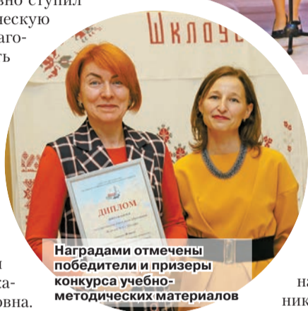
Наградами отмечены победители и призеры конкурса учебно-методических материалов