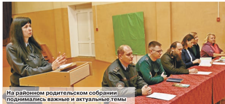
На районном родительском собрании поднимались важные и актуальные темы

В рамках данной акции на базе ЦДТ «Прамь» прошло районное родительское собрание. Приглашены на него были родители, чьи дети признаны находящимися в социально опасном положении, нуждающимся в государственной защите.