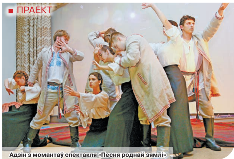
Адзін з момантаў спектакля «Песня роднай зямлі»