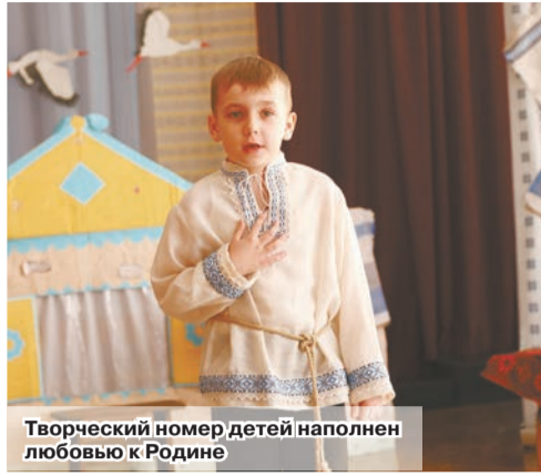
Творческий номер детей наполнен любовью к Родине

В трех учреждениях дошкольного образования района: детских садах №6 и №2, дошкольном центре развития ребенка в аг.Александрии реализуется республиканский инновационный проект «Внедрение сетевой модели формирования гражданско-патриотической позиции обучающихся: региональная модель». Главная его цель – создание условий для формирования гражданско-патриотической позиции маленьких граждан Беларуси.