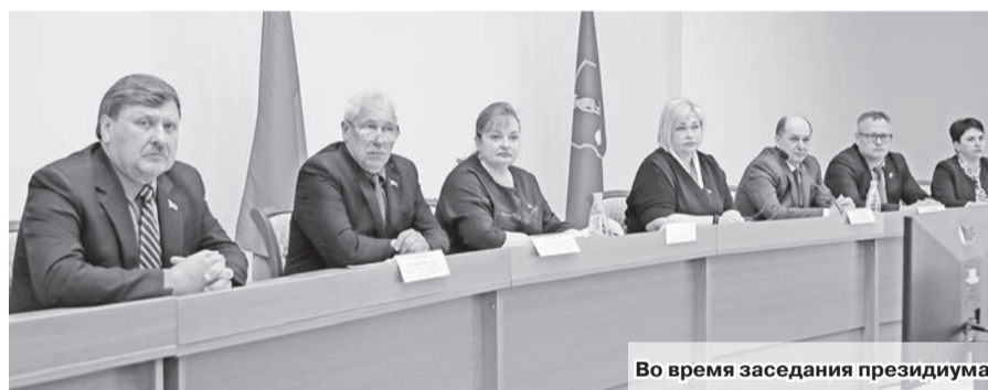
Во время заседания президиума

До купального сезона осталось меньше месяца. С июня можно будет отдохнуть на новом пляже в д.Путники. В настоящее время там ведутся работы по его благоустройству. Определено место для пляжа, обследовано озеро. После очистки водоема будут поставлены буйки, размещено оборудование, информационные стенды и т.д.