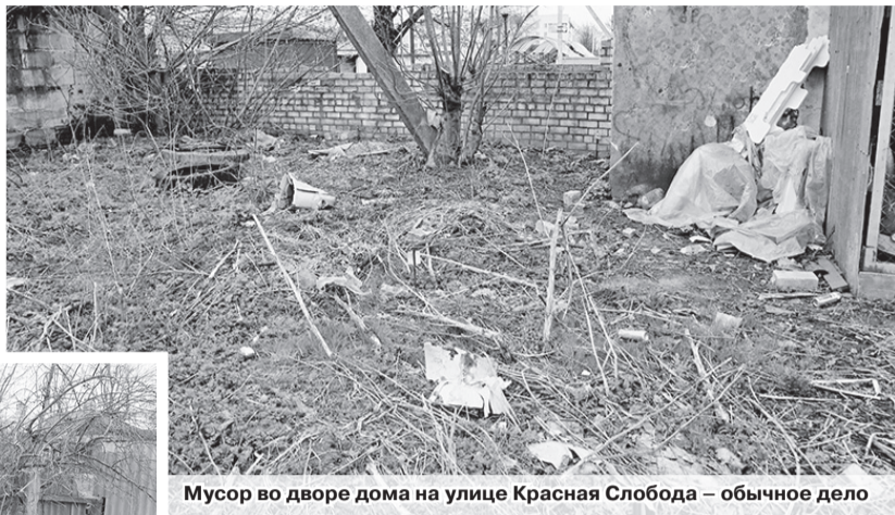
Мусор во дворе дома на улице Красная Слобода – обычное дело

Тема организации стихийных свалок на страницах «районки» поднимается с завидной регулярностью. Масштабную свалку можно увидеть, к примеру, в городе Шклове на улице Красная Слобода.