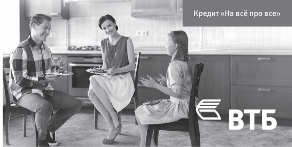
Кредит «На всё про все»

И еще один приятный факт — полное отсутствие