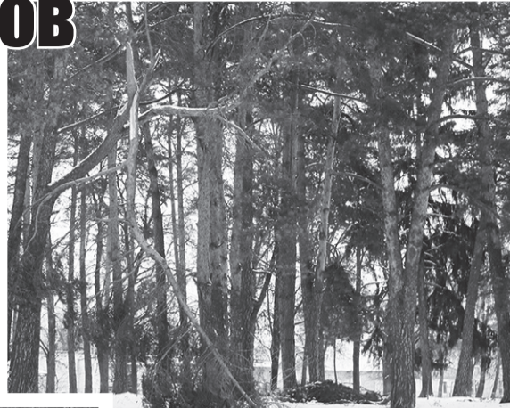
В городском парке зимой опасно из-за сломанных деревьев, сучьев, веток...