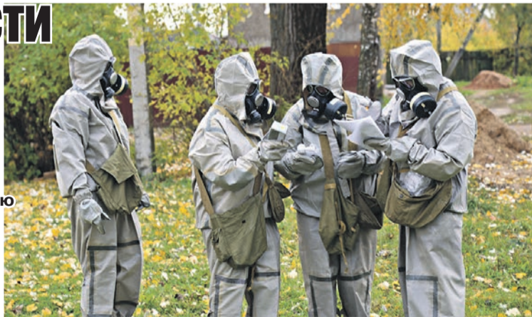
Группа санэпидразведки районного центра гигиены и эпидемиологии отбирает пробы земли, травы для изучения радиоактивного загрязнения.

На минувшей неделе, 18-19 октября, наш район принял участие в республиканских командно-штабных учениях по радиационной безопасности и реагированию на другие чрезвычайные ситуации. Местные органы власти получили информацию об оперативной обстановке и отработывали конкретные действия.