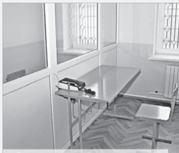
Здесь проходят свидания с близкими.

Помещения изолятора располагаются на одном этаже. Вдоль коридора – несколько камер, расположенных друг напротив друга: двух и четырехместные. В каждой камере минимальный запас удобств: санузел, умы-