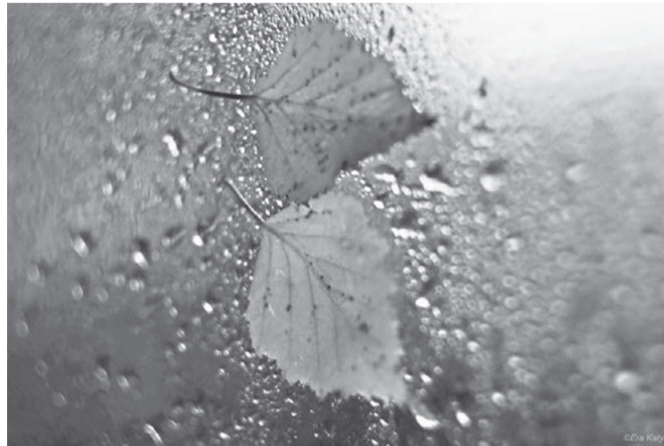
Фото Екатерины ЕРОШЕВИЧ.

Яна ж ушчэнт смяялася заўжды: – Кахаю вас я, хлопчыкі, абоіх... Не адчувала нашае нуды, Была заўсёды ў радасным настроі.