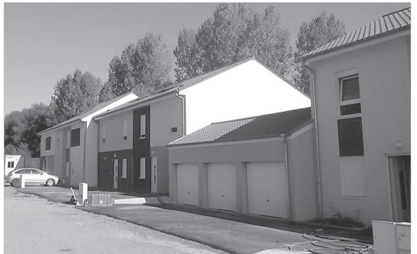
Шкловские дома во Франции.

Официальная церемония открытия послом Беларуси во Франции Павлом Латушко и мэром г. Вильрю Аланом Казони памятной доски, посвященной присвоению имени Жана Эммануэля Жилибера жилому кварталу, состоялась недавно во французском городе Вильрю (регион Лотарингия). Для Шкловщины это событие знаково тем, что квартал возводится из домов, произведенных филиалом «Домостроение» РУП «Завод газетной бумаги».