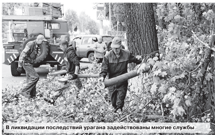
В ликвидации последствий урагана задействованы многие службы

Погода продолжает испытывать шкловчан на прочность. В конце июля ливень, размывший проезжие пути в некоторых населенных пунктах, добавил работы дорожным службам. И теперь новый каприз природы: ураган с дождем, обрушившийся 7 августа, принес с собой новые происшествия.