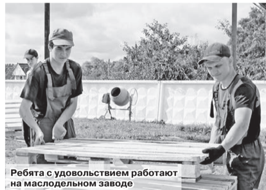
Ребята с удовольствием работают на маслодельном заводе