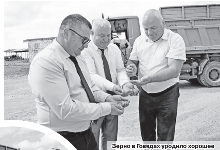
Зерно в Говядах уродило хорошее