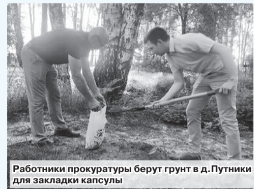
Работники прокуратуры берут грунт в д.Путники для закладки капсулы

Работниками прокуратуры Шкловского района 2 августа в целях последующего увековечивания памяти жертв геноцида проведены повторные осмотры мест массового уничтожения мирного населения, расположенного недалеко от сельского кладбища в д.Путники Шкловского района и массового захоронения людей, расположенного вблизи ул.Рыжковичской в г.Шклове (возвышенность на еврейском кладбище «Бисхайм»). В ходе осмотра изъят грунт (земля) для последующей закладки капсулы в крипте Храма-памятника Всех Святых в г.Минске в рамках празднования Дня народного единства 17 сентября.