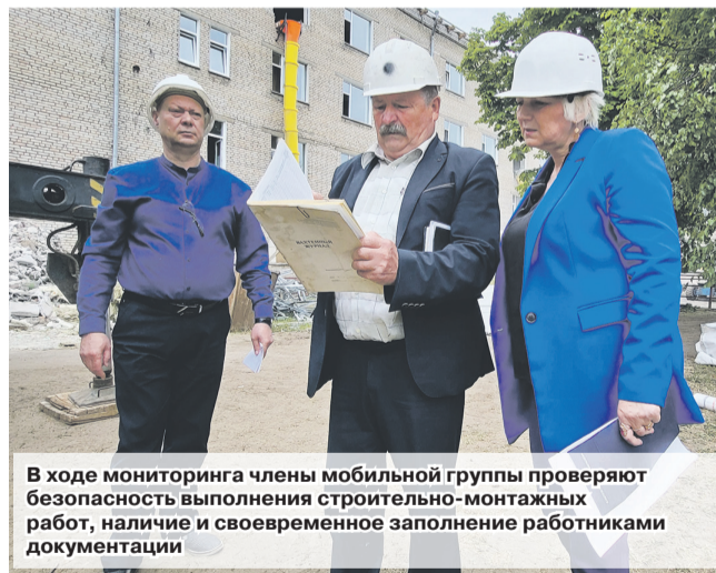
В ходе мониторинга члены мобильной группы проверяют безопасность выполнения строительного-монтажных работ, наличие и своевременное заполнение работниками документации