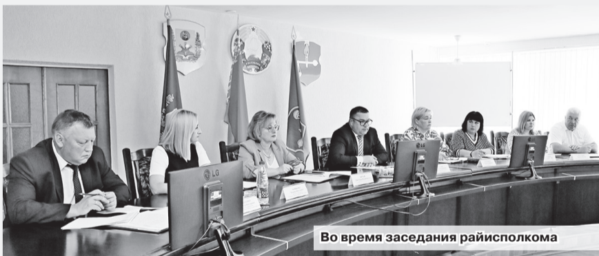
Во время заседания райисполкома