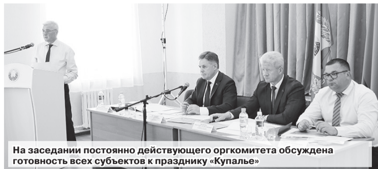
На заседании постоянно действующего оргкомитета обсуждена готовность всех субъектов к празднику «Купалье»

началом праздничного концерта в небе развернутся флаги Беларуси и России как символы дружбы и единства. Во время фестиваля традиционно пройдет финал республиканского семейного сельскохозяйственного проекта «Властелин села». В Александрии будут чествовать молодые семьи, которые добились результатов и прошли серьезные испытания.