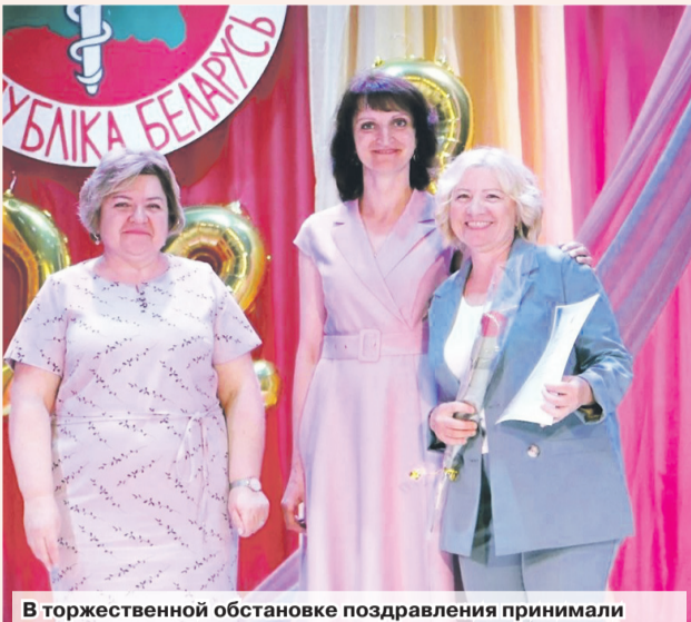
В торжественной обстановке поздравления принимали лучшие медработники района