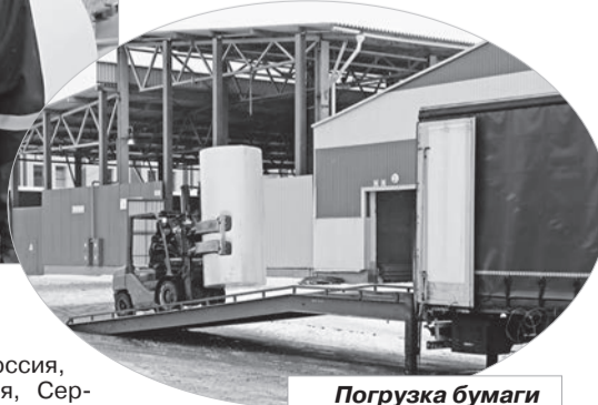
Погрузка бумаги на экспорт.

На предприятии активно ведется работа по освоению новых рынков сбыта. Так, в 2017 году продукция начала поставляться в Албанию, Венгрию, Францию и др.