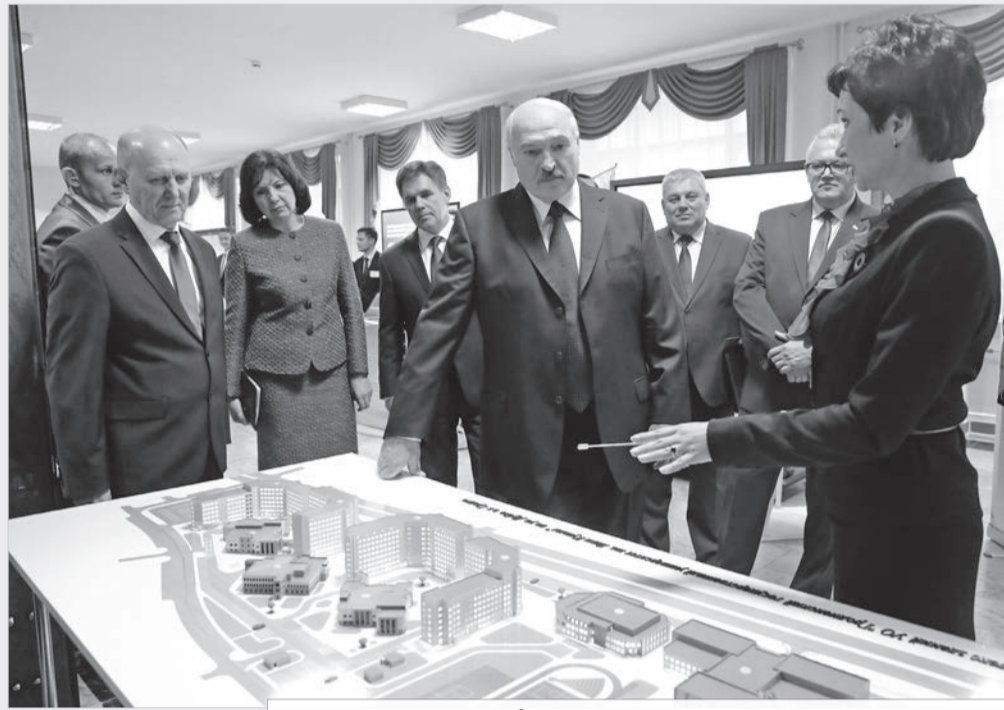
Президент Республики Беларусь Александр Лукашенко во время посещения Гродненского госуниверситета.

Одним из главных мероприятий рабочей поездки Александра Лукашенко стало посещение Гродненского государственного университета имени Янки Купалы. Глава государства отметил, что уже давно собирался посетить этот вуз и встре-