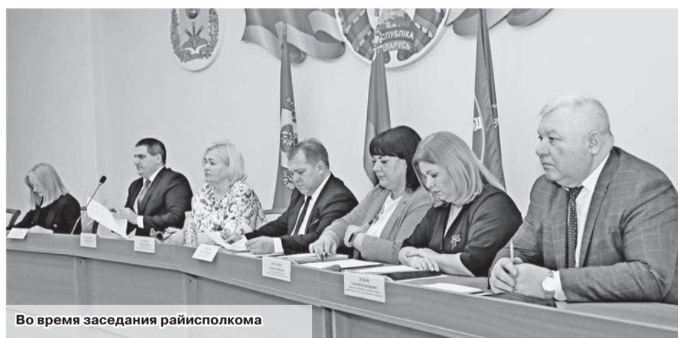
Во время заседания райисполкома

Информация начальника РОВД членами исполкома принята к сведению, работа субъектов профилактики правонарушений по предупреждению правонарушений и преступлений на территории