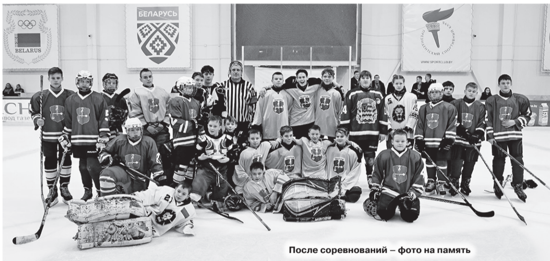
После соревнований – фото на память