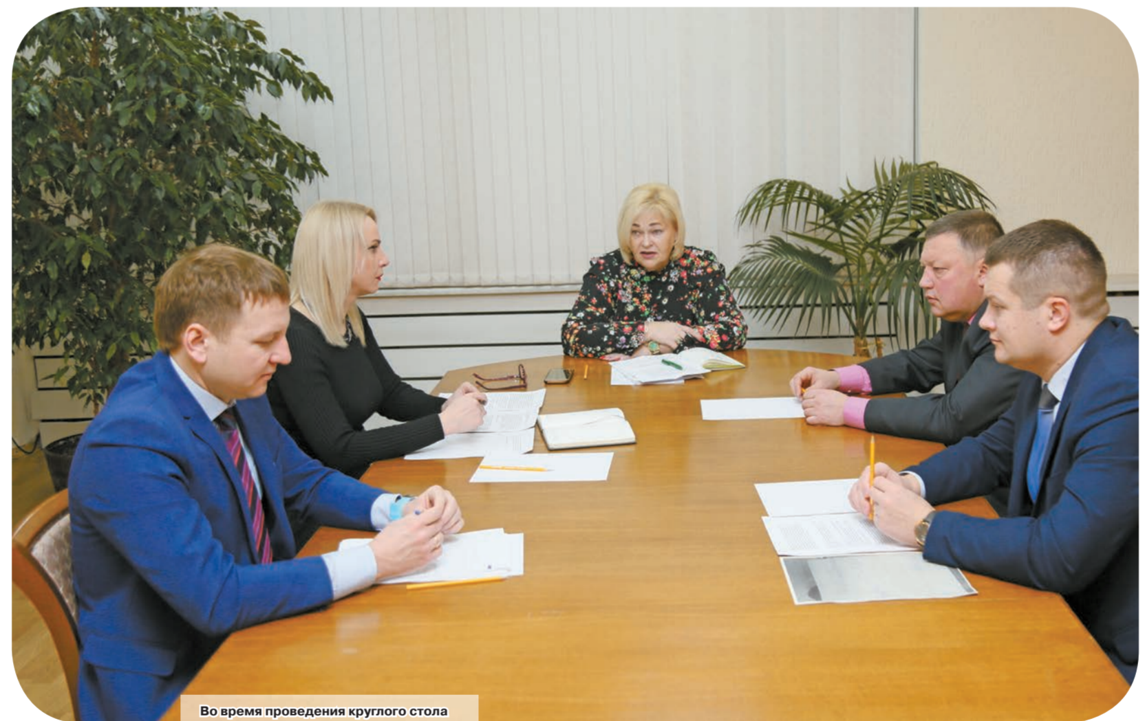
Во время проведения круглого стола

Елена МИНАКОВА minakova_alyona@mail.ru