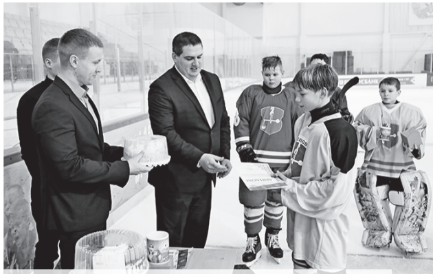
Лучшим командам и хоккеистам были вручены дипломы и подарки

Лучших за годы работы Ледовой арены и проведения «Золотой шайбы» было немало. Выходцы из Шклова играют за разные команды в Чемпионате Республики Беларусь. Не подведут в будущем и те ребята, которые участвуют в турнире сейчас, уверен