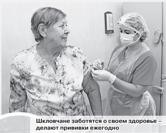
Шкловчане заботятся о своем здоровье – делают прививки ежегодно