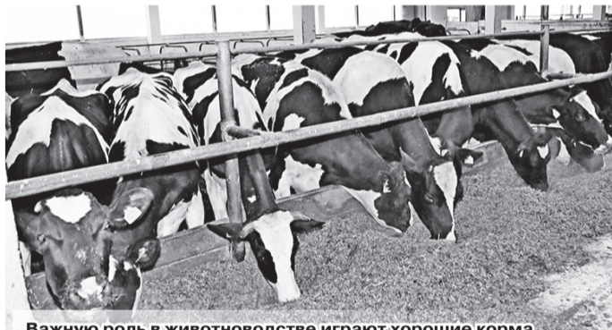
Важную роль в животноводстве играют хорошие корма

лёв, подобные семинары планируется проводить ежемесячно на базе различных сельхозорганизаций. Цель их – обмен опытом, обсуждение рабочих моментов, недоработок и принятие мер по их устранению. Как следствие – повышение эффективности животноводческой отрасли.