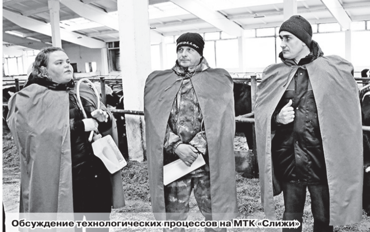
Обсуждение технологических процессов на МТК «Слижи»