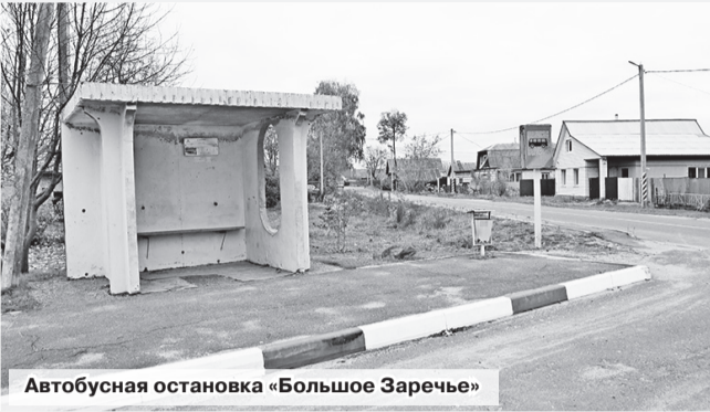
Автобусная остановка «Большое Заречье»

Недавно в издательский дом «Шклов-инфо» по электронной почте пришло письмо от шкловчанки, проживающей на Заречье. «Добрый день. Убедительная просьба на остановках в расписании указать, какие автобусы идут на Большое Заречье. Не знают даже кондукторы», – указано в сообщении.