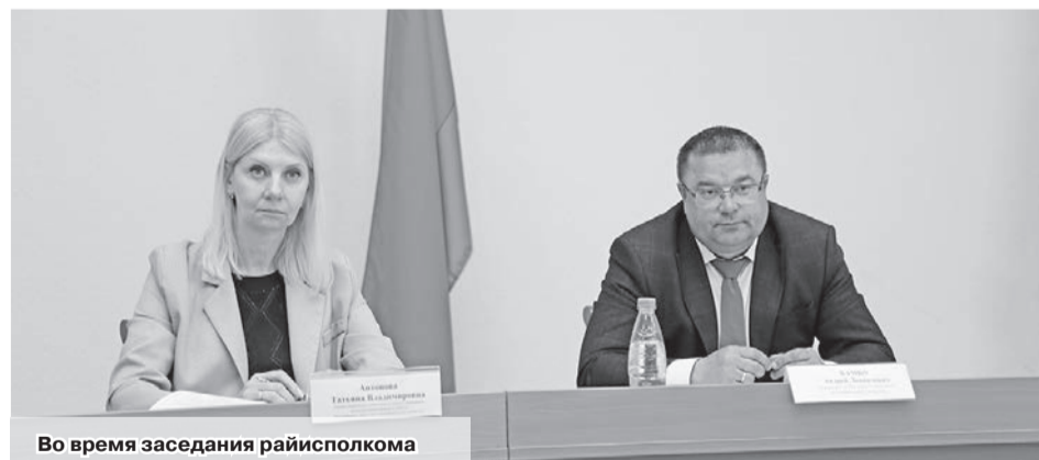
Во время заседания райисполкома

«Формирование кадрового резерва – комплексный, системный и сложный элемент управления кадрами, про важность которого сегодня необходимо знать и помнить руководителям. Правильно выстроенная организация работы с кадровым резервом является конкурентным преимуществом организации и гарантом ее стабильности, обеспечивает нужными