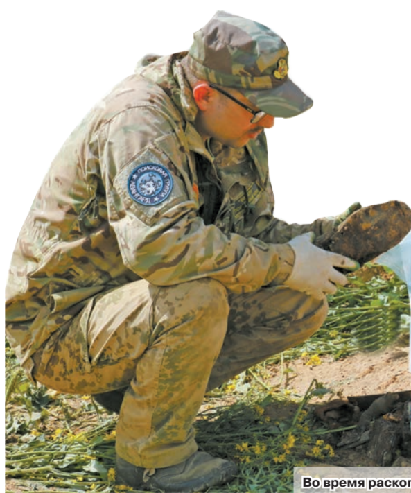
Во время раскопок у деревни Апполоновка