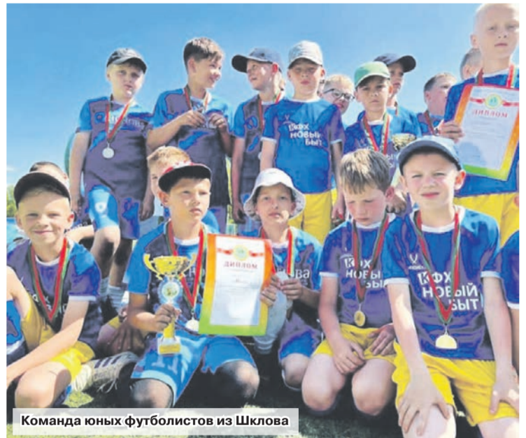
Команда юных футболистов из Шклова

Вот уже не один десяток лет республиканские соревнования среди детей и подростков «Кожаный мяч» на призы Президентского спортивного клуба становятся для ребят, которые не смогли попасть в специализированные секции, школой большого футбола. В том числе и для шкловчан – победителей и призеров от районного до республиканского этапов. Этот год не стал исключением.