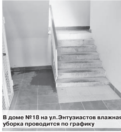
В доме №18 на ул.Энтузиастов влажная уборка проводится по графику

Наталья КАЗЕБРОДСКАЯ