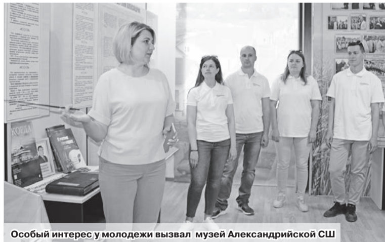
Особый интерес у молодежи вызвал музей Александрийской СШ

Самые активные, самые креативные, самые творческие, не просто готовые привнести любую идею, но и умеющие ее реализовать, парни и девушки – все это Молодежный совет РУП «Могилевоблгаз», который 31 мая отпраздновал свой первый день рождения. А провести праздничные мероприятия ребята решили на Шкловщине.