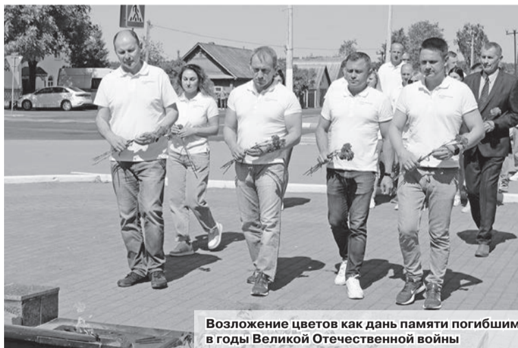
Возложение цветов как дань памяти погибшим в годы Великой Отечественной войны

Затем на Трофимовой кринице состоялся открытый диалог с уча-