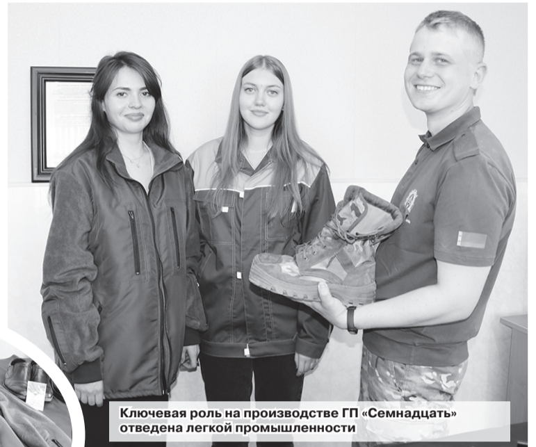
Ключевая роль на производстве ГП «Семнадцать» отведена легкой промышленности

принимаются заявки от населения. Одно из свидетельств успешной работы – положительные отзывы партнеров,