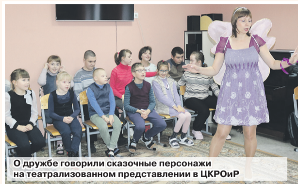
О дружбе говорили сказочные персонажи на театрализованном представлении в ЦКРОиР

Наталья КАЗЕБРОДСКАЯ natali.ya1988@mail.ru