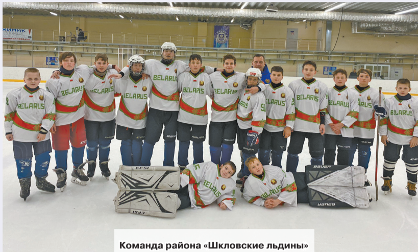
Команда района «Шкловские льдины»

В Новополоцке прошла Спартакиада Союзного государства для детей и юношества «Олимпийские надежды». В соревнованиях по хоккею Шклов и Могилевскую область представила сборная нашего района «Шкловские льдины» – бронзовые призеры республиканского этапа турнира «Золотая шайба» на призы Президента Республики Беларусь.