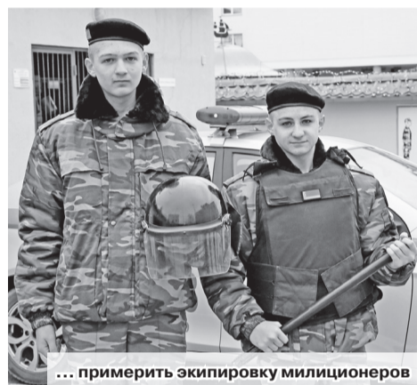
... примерить экипировку милиционеров

высшие учебные заведения системы Министерства внутренних дел, особенностях принятия на службу в Департамент охраны, предоставляемых льготах и социальных гарантиях. Дополнением к словам стал фильм о деятельности Департамента охраны.