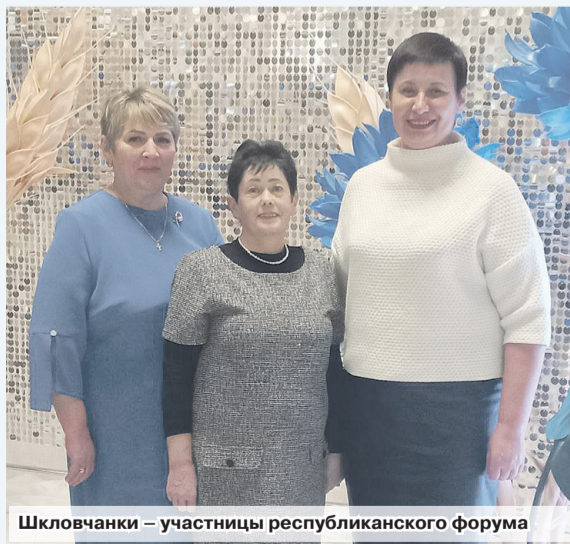
Шкловчанки – участницы республиканского форума

II Республиканский форум тружениц села, который состоялся на прошедшей неделе в Минске под эгидой Белорусского союза женщин совместно с Минсельхозпродом и Белорусским профсоюзом работников АПК, собрал множество женщин со всей страны. Все они – простые труженицы, ежедневным старанием приносящие пользу нашему обществу и государству.