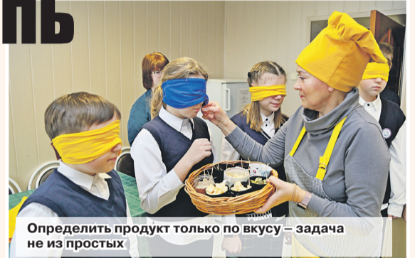
Определить продукт только по вкусу – задача не из простых

В рамках месячника на базе Шкловской специальной школы-интерната прошла инклюзивная квест-игра «Мир без границ». Участниками уникального тифлоквеста стали учащиеся не только спецшколы, но и других учреждений образования города. Организаторы мероприятия предоставили ребятам уникальную возможность погрузиться в абсолютную темноту и почувствовать, как это – жить на ощупь. Программа квеста включала пять станций: «Переводчики», «Дорожная», «Спортивная», «Кули-