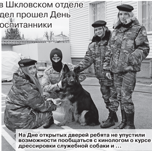
На Дне открытых дверей ребята не упустили возможности пообщаться с кинологом о курсе дрессировки служебной собаки и ...

Встреча учащихся старших классов с сотрудниками Шкловского отдела охраны была познавательной и увлекательной. Воспитанники военно-патриотического клуба «Дозор» поблагодарили милиционеров не только за мероприятие, но и за их нелегкую, но важную для общества и государства службу.