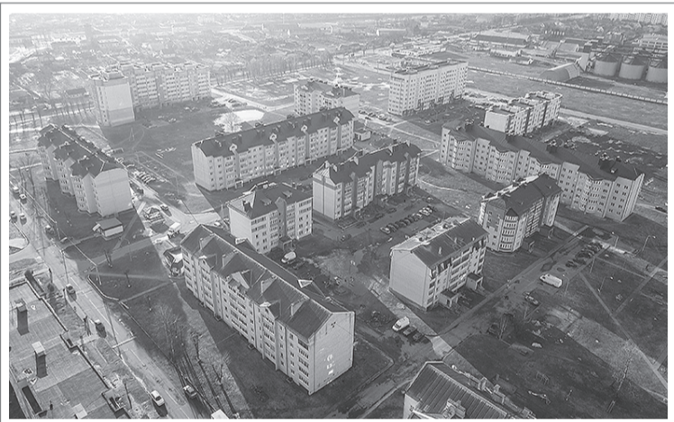
Улица Энтузиастов г.Шклова.