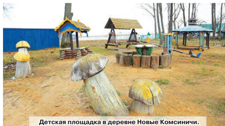
Детская площадка в деревне Новые Комсиничи.