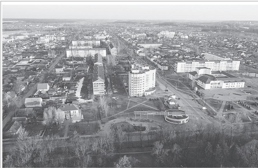
Город Шклов с высоты птичьего полета.

В большой семье девчонкой я росла. Любил меня отец, и мама берегла, Сестрички две как маков цвет И брат, которого милее нет. Не понимала счастья я тогда, Казалось, будет так всегда. Но наступила юности пора, И жизнь меня рекою понесла. Учеба, 30 лет, семья, ребенок... Не верится, что мне 50 уж лет! Наш домик за рекой, которого уж нет, И луг огромный, где вырос мой сынок, Березы две, которым по 100 лет. С любовью их садил отец, Мой папочка, которого уж нет. И мамы был быстротечен век. И только память сохраняет их портрет, Где молоды, красивы эти люди, что мне дороже нет. Я благодарна вам за все: за ласку, за тепло, заботу, Конечно же, за свет родного очага. Молитвы ваши и теперь я чувствую с небес. Они хранят и греют нас, И живы вы в веках.