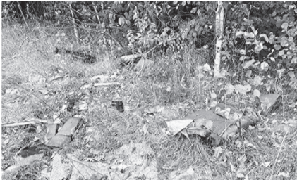
Всего в нескольких метрах от даров леса располагаются сразу две несанкционированные свалки

Так, за агрогородком Староселье, птичником ОАО «Александровское» по направлению к деревне Хотьково вдоль проезжей дороги находится лес, куда зачастую грибники направляются за опятами. Вот только в этот сезон их ждал еще один сюрприз – несанкционированные свалки на опушке леса. И состоят они не только из кусков шифера, рубероида, бумаги, пленки, одеяла, но и из разорванных водительских сидений, бампера и других запчастей автомобиля. И эта «красота» не остается незамеченной у грибников.