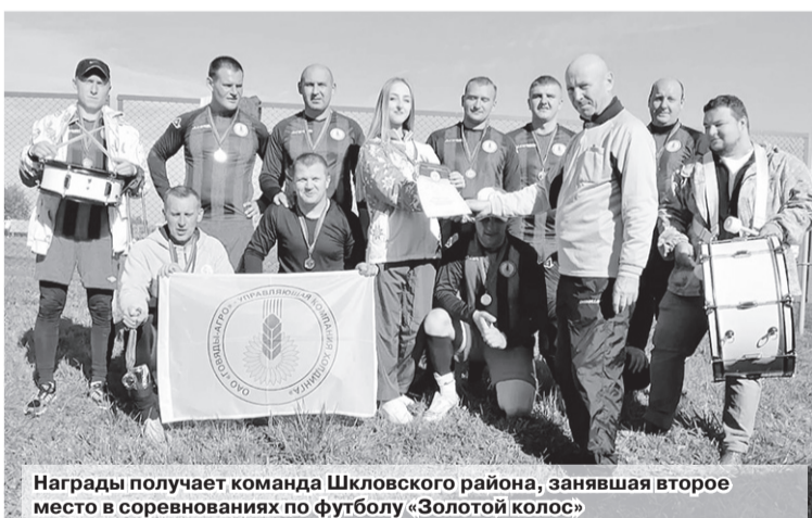
Награды получает команда Шкловского района, занявшая второе место в соревнованиях по футболу «Золотой колос»

29 и 30 сентября в агрогородке Вейно прошли финальные соревнования по футболу среди сельских жителей в рамках областной спартакиады «Золотой колос». За победу боролись команды из Шкловского, Могилевского, Мстиславского и Костюковичского районов.