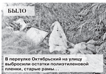
БЫЛО В переулке Октябрьский на улице выбросили остатки полиэтиленовой пленки, старые рамы...

Марина РАНДИЦКАЯ marion795@mail.ru