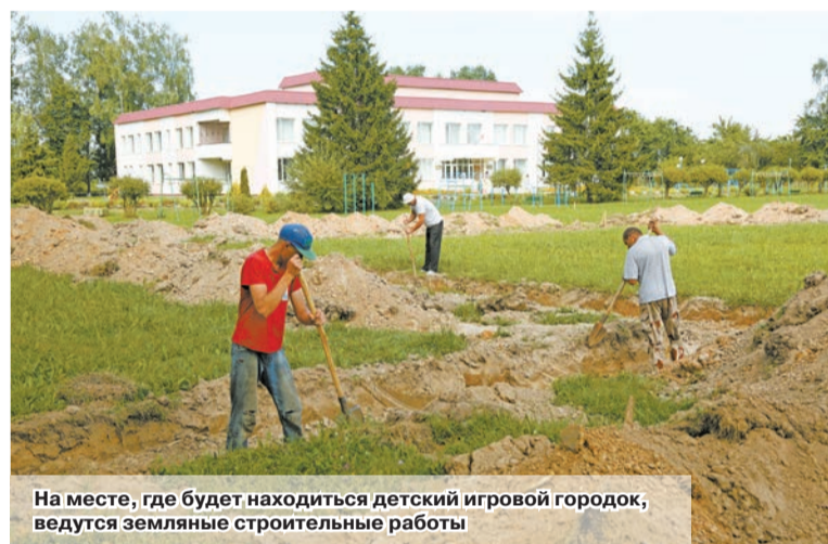
На месте, где будет находиться детский игровой городок, ведутся земляные строительные работы

– Совместная деятельность депутатов и органов территориального общественного самоуправления дает определенные результаты, так как благодаря ей реализовываются и воплощаются в жизнь, в первую очередь, гражданские инициативы. Только за последние годы совместно с жителями агрогородков Черноручье, Городец, деревни Большой Межник произведены закупка детского игрового и спортивного оборудования и его установка. Удобные, современные и комфортные объекты направлены на оздоровление и активное времяпрепровождение детей и взрослых на свежем воздухе и пользуются большим спросом у местного населения. Приятно, что в скором времени игровой городок появится и в Фашевке.