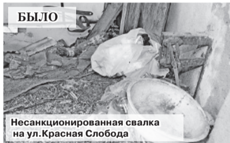
БЫЛО Несанкционированная свалка на ул.Красная Слобода