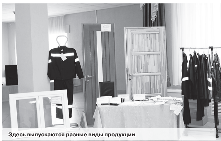
Здесь выпускаются разные виды продукции

ГП «Семнадцать» – предприятие многопрофильное, в его состав входят три цеха и пять производственных участков, где выпускается самая различная продукция. В основном оно ориентировано на производство продукции для нужд исправительных учреждений и силовых структур. Участвуя в тендерах,