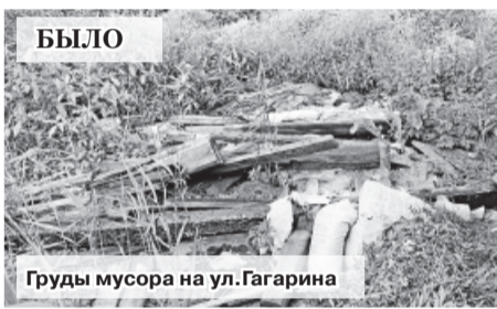
БЫЛО Груды мусора на ул.Гагарина