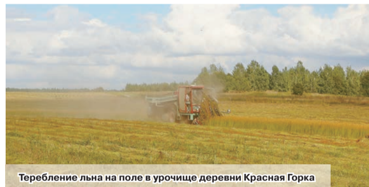
Теребление льна на поле в урочище деревни Красная Горка