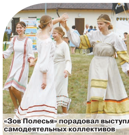
«Зов Полесья» порадовал выступлениями самодеятельных коллективов