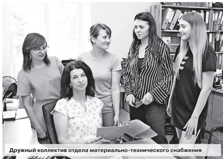
Дружный коллектив отдела материально-технического снабжения

Развитие экономики – именно об этой задаче говорится сейчас на всех уровнях. «Экономика – вопрос номер один. Будет экономика – все у нас получится», – слова Президента на недавнем заседании Совета Министров. Один из примеров успешной работы промышленности в нашем городе и развития экономики – ГП «Семнадцать». Еще недавно это предприятие было убыточным, сейчас же оно показывает очень хорошие результаты в своей деятельности.