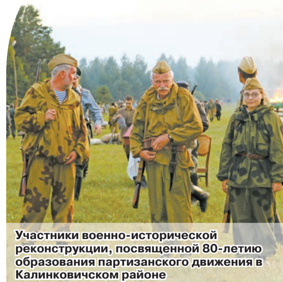
Участники военно-исторической реконструкции, посвященной 80-летию образования партизанского движения в Калинковичском районе