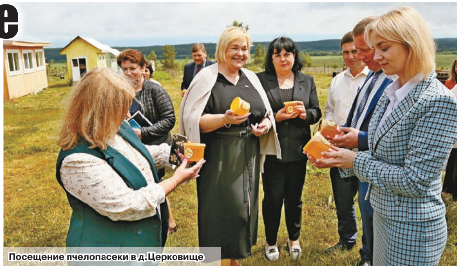
Посещение пчелопасеки в д.Церковище

– В ведении нашего фермерского хозяйства 338 гектаров пашни. Мы занимаемся только растениеводством. Сею зерновые, зернобобовые культуры, картофель, горох. Несмотря на то, что этот год для сельхозорганизаций очень непростой,