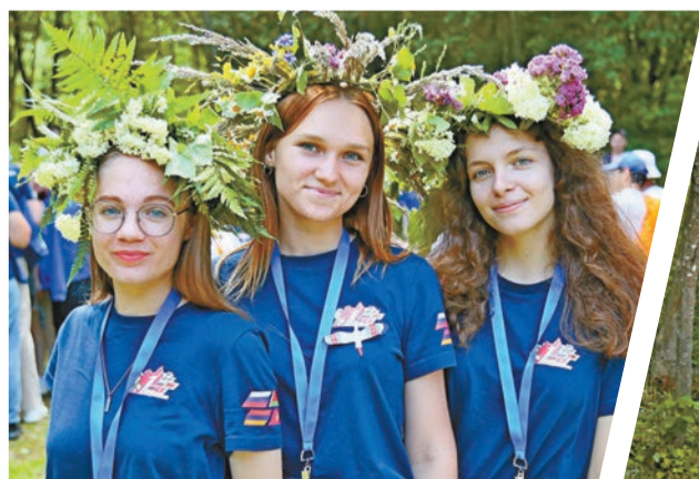
В Александрии делегация «Поезда Памяти» получила много положительных эмоций