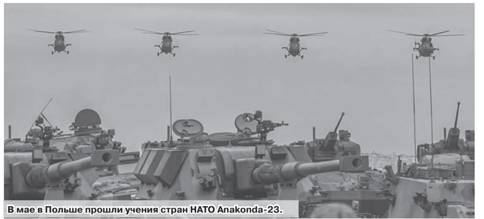
В мае в Польше прошли учения стран НАТО Anakonda-23.

Фактически они бросают вызов тому союзу, который составили Германия и Франция. Именно поляки являются троянским конем Великобритании и США в ЕС. В связи с этим европейская бюрократия на предстоящих выборах в Польше будет ставить на гражданскую платформу во главе с Дональдом Туском. То есть для них это более понятный руководитель, который будет двигаться в фарватере европейской политики. Фактически схватка на выборах будет происходить между проевропейскими либералами и польскими националистами-клерикалами. Кто бы ни победил, в отношении нас особых изменений в польской внешней политике не произойдет. Потому что польские националисты, исходя из своих устремлений в построении Великой Польши «от можа до можа», отталкиваются от того, что им необходимо взять под контроль территорию нашей страны (плюс к враждебности их подталкивает извечный комплекс неполноценности по отношению к России). Европейские либералы тем временем будут поддерживать санкционную агрессивную политику в отношении Беларуси, потому что нашу страну им необходимо загнать в общий