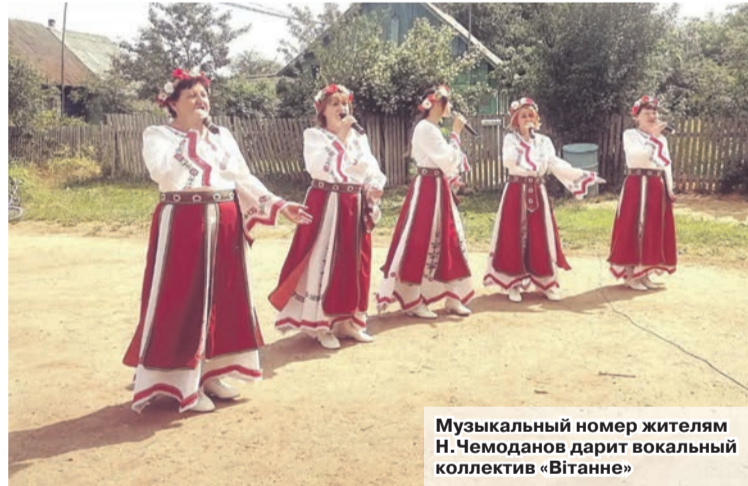
Музыкальный номер жителей Н.Чемоdanaх дарит вокальный коллектив «Вітанне»

По давно сложившейся традиции Городецкий сельисполком совместно с Городецким СДК, библиотекой, Домом ремесел провел праздник деревни «Живи, село родное» в Новых Чемоdanaх. Народное гулянье собрало вместе жителей, гостей и земляков.