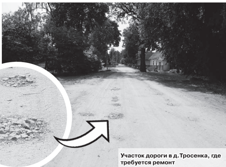
Участок дороги в д.Тросенка, где требуется ремонт

— Подъезд к деревне в удовлетворительном состоянии. Чего не скажешь про участок дороги по самому населенному пункту. Если зимой ее чистили, то проблем с проездом не возникало, а сейчас ее состояние оставляет желать лучшего. Весной так и не провели грейдирование. После весенней распутицы выравнивал дорожное покрытие один из местных фермеров. Но у него нет специальной тех-