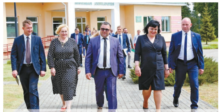
Во время выездного заседания в Александрии члены исполкома посетили амбулаторию врача общей практики...

правоохранительных органов невозможно добиться желаемого результата по снижению уровня рецидивной преступности. Поэтому важно совместно с управлением по труду, занятости и социальной защите райисполкома, постоянно действующей комиссией по координации работы по содействию занятости населения продолжить ежемесячное проведение «Ярмарки вакансий», предлагать рабочие места тем, кто не имеет постоянной работы, ведет асоциальный образ жизни, а также необходима поддержка таких людей в коллективах.