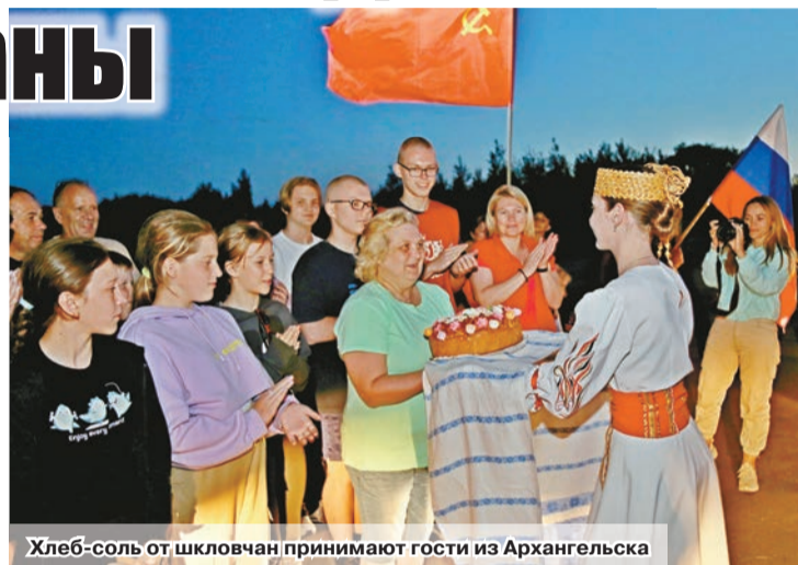
Хлеб-соль от шкловчан принимают гости из Архангельска

В составе экипажей – 35 человек в возрасте от 9 до 65 лет – неравнодушные жители Архангельска, поморские поисковики, представители центра «Патриот». Их главная цель – за десять дней посетить места ожесточенных боев Великой Отечественной войны, где наши деды и прадеды сражались с фашизмом и погибли за Отечество. В ходе архивных работ было установлено, что на тер-