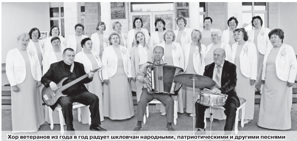
Хор ветеранов из года в год радует шкловчан народными, патриотическими и другими песнями

Завтра, 23 июня, свой 35-летний юбилей отмечает один из известных творческих коллективов в районе – народный хор ветеранов труда «Мелодия». Его творческой биографии можно позавидовать. Уже невозможно назвать точное количество выступлений за эти годы, исполненных песен, но все они о нашей любимой Родине, Шкловщине, Великой Отечественной войне, любви, семье и дружбе.