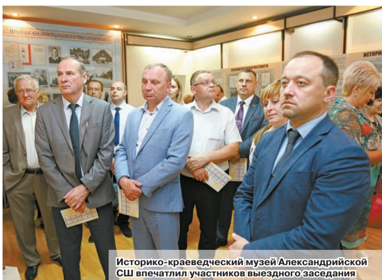
Историко-краеведческий музей Александрийской СШ впечатлил участников выездного заседания