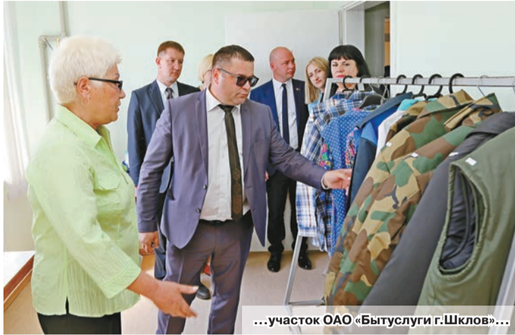
...участок ОАО «Бытслужги г.Шклов»...