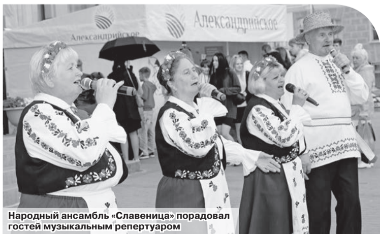
Народный ансамбль «Славеница» порадовал гостей музыкальным репертуаром

Елена МИНАКОВА minakova_alyona@mail.ru