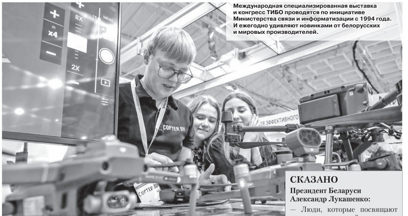
Международная специализированная выставка и конгресс ТИБО проводятся по инициативе Министерства связи и информатизации с 1994 года. И ежегодно удивляют новинками от белорусских и мировых производителей.

Белорусская наука выходит на передовые позиции — и в плане собственного развития, и среди приоритетов нашего государства. Президент нацеливает на развитие направлений, обращенных в будущее, включая биотехнологии, — такое заявление он сделал, заслушивая на днях доклад об интеграции биологии и медицины. При этом Глава государства подчеркнул, что это лишь одно из направлений, которому государство намерено уделить особое внимание. В целом же упор будет сделан на развитие науки как таковой. «Посмотрим другие направления, связанные с обороной и с развитием экономики, которые обращены в будущее. Как, допустим, атомная энергетика, космос, БНБК (Белорусская национальная биотехнологическая корпорация. — Прим. ред.) построили, — пояснил Александр Лукашенко. — Вот эти направления будут всегда востребованы. Давайте подумаем, как мы, чтобы не отстать, будем их развивать. Чтобы не потерять свою школу и не отстать».