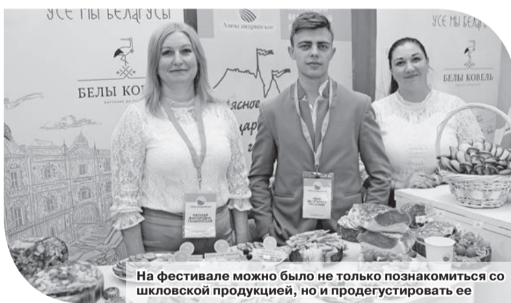
На фестивале можно было не только познакомиться со шкловской продукцией, но и продегустировать ее

Около 200 артистов со всех уголков района участвовали в большом концерте, на улице и в фойе методического центра развернулась выставка достижений. Целая палитра проектов, работ мастеров декоративно-прикладного искусства, мастер-классы создавали особую атмосферу.