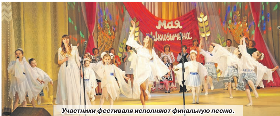
Участники фестиваля исполняют финальную песню.

Перед началом основной программы на втором этаже РДК была организована выставка декоративно-прикладного искусства «Народные таланты Гарадзецкай зямлі». Подготовили ее работники Городецкого сельисполкома, сельской библиотеки, Городецкого Дома ремесел, УПК д/с – СШ, дома-музея Петра Алейникова, ФАПа и сельхозорганизации, а также дети и родители детского дома семейного типа и отдельные