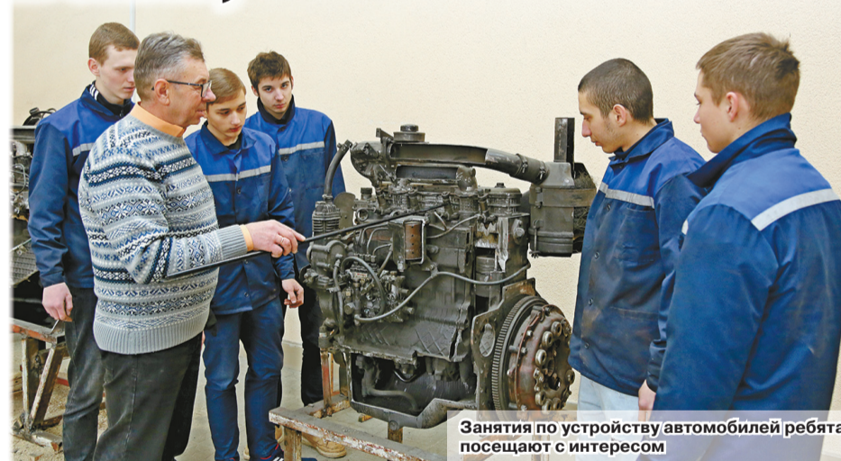
Занятия по устройству автомобилей ребята посещают с интересом

«Любичи-Агро», «Александрийское», «Новогородищенское» – встретились с учащимися, чтобы рассказать им о работе на производстве, в сельском хозяйстве по специальности. Отмечено, что многие