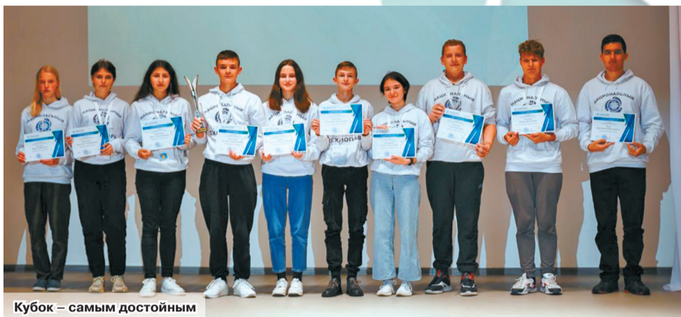
Кубок – самым достойным

О том, как можно стать обучающимся технопарка, рассказала методист Шкловского рай-