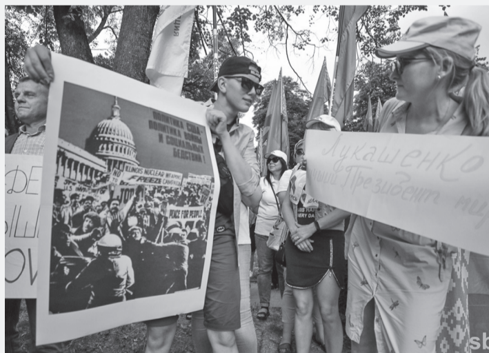
Летом 2022 года у посольства США в Минске провели пикет патриоты, возмущенные оскорбительным поздравлением с Днем Независимости Беларуси, опубликованным в официальном аккаунте посольства одной из социальных сетей. В нем ставился знак равенства между освобождением Беларуси от нацизма и мятежом 2020 года, где оплаченные предатели под коллаборационистским флагом пытались подорвать целостность нашей республики.

С нами Бог! А значит, и правда за нами».