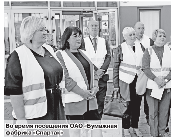
Во время посещения ОАО «Бумажная фабрика «Спартак»