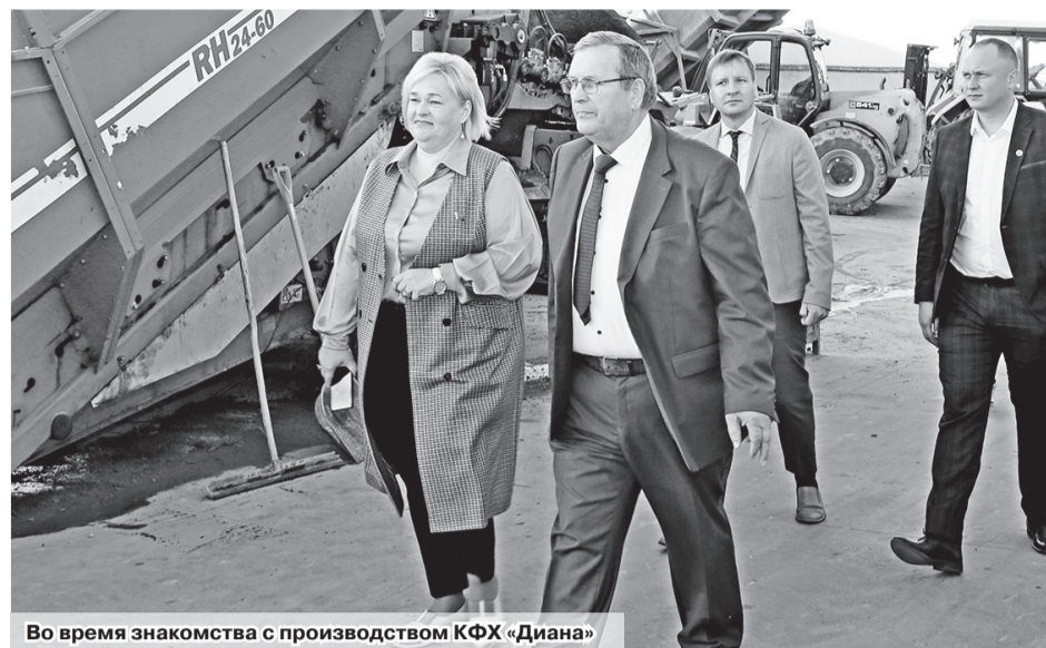
Во время знакомства с производством КФХ «Диана»

Среди самых крупных – ОАО «Могилевлифтмаш», Могилевоблдорстрой и др. На экспорт отправляются противовесы, которые используются в лифтовом оборудовании. Участники Дня Совета ознакомились с тем, как на предприятии осуществляется производство, узнали о перспективах его развития. Сегодня здесь работают 26 человек, в планах – расширение производства, приобретение новой техники, увеличение количества рабочих мест.