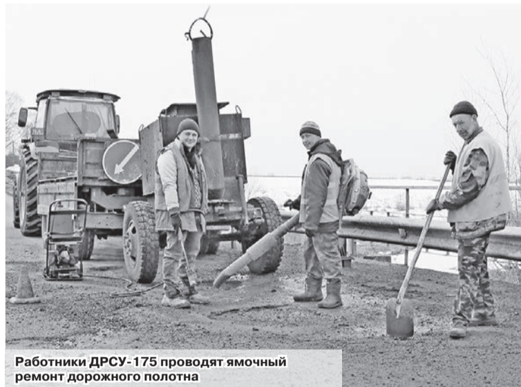
Работники ДРСУ-175 проводят ямочный ремонт дорожного полотна