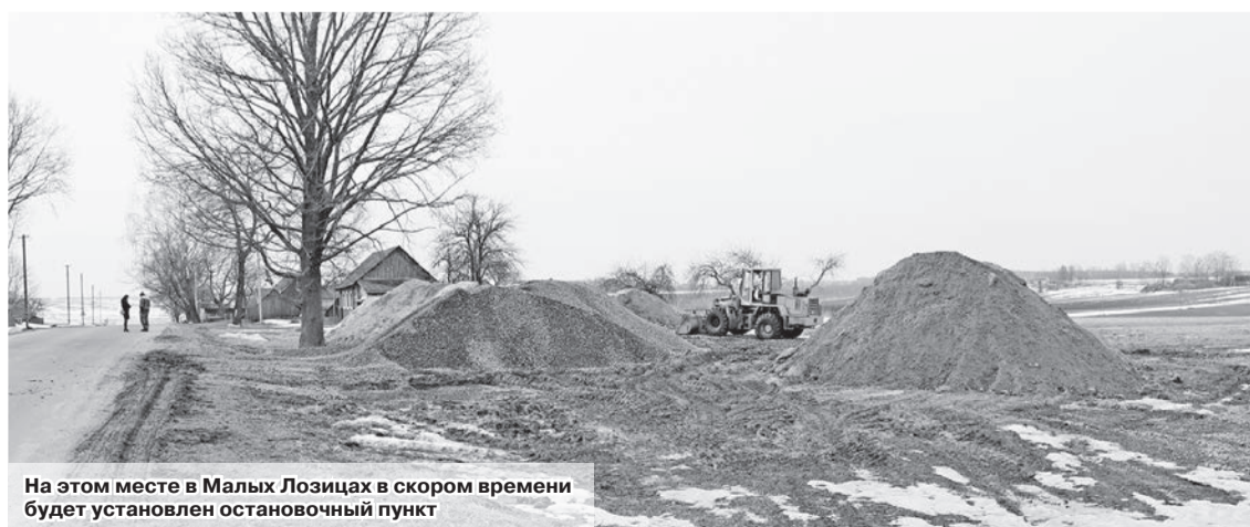
На этом месте в Малых Лозицах в скором времени будет установлен остановочный пункт