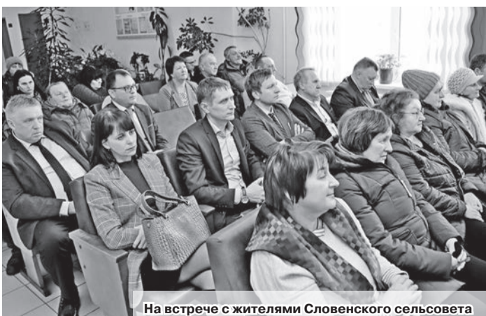
На встрече с жителями Словенского сельсовета

В Шкловском районе продолжают выездные встречи руководства райисполкома, районного Совета депутатов, а также служб и организаций района с населением. Такие мероприятия прошли во всех агрогородках района и городе Шклове, сейчас на очереди – малонаселенные пункты.