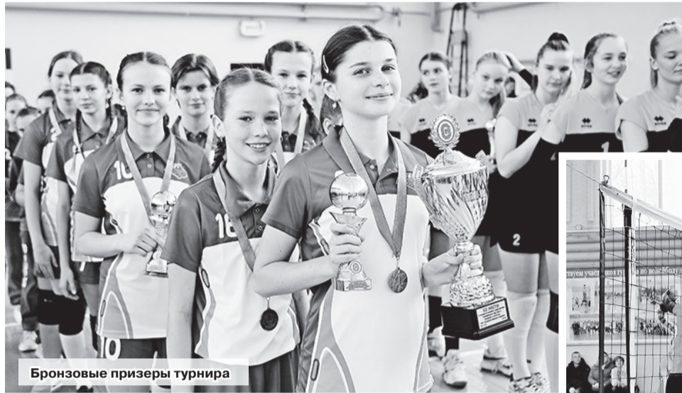
Бронзовые призеры турнира

С 10 по 12 марта в спортивном зале специализированной детско-юношеской спортивной школы олимпийского резерва Шкловского района проходил Международный турнир по волейболу на призы ОАО «Бумажная фабрика «Спартак» среди девушек 2009 г.р. и моложе из Москвы, Калининграда, Смоленска, Минска и Могилева, которую представили юные волейболистки из Шклова.