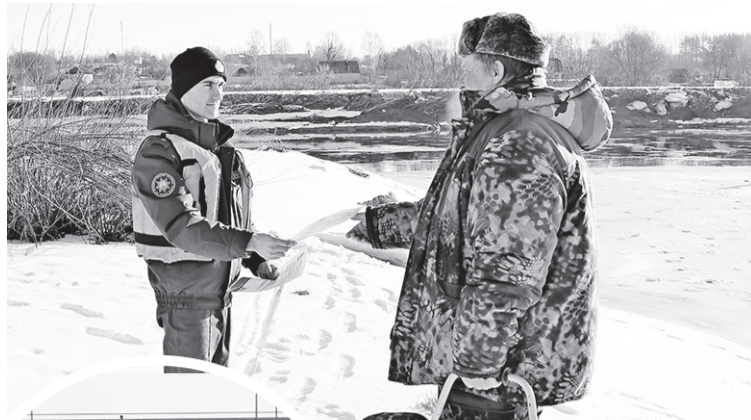
Во время рейдов спасатели напоминают рыбакам правила безопасности

Мартовская погода неустойчивая, но с каждым днем солнце пригревает все больше. Тает снег, сходит с рек лед. И, казалось бы, любителям зимней рыбалки пора спрятать свое оснащение до следующего сезона, но нет, они с завидным упорством продолжают выходить на лед, который с каждым днем становится все опаснее.