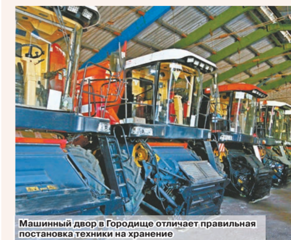
Машинный двор в Городецке отличает правильная постановка техники на хранение

Чем ближе время посевной, тем больше внимания к сельскохозяйственной технике. Затягивать с ремонтом дальше некуда: на линейке готовности она должна стоять уже. О том, как быстро и качественно подготовить технику к весне, знают в ОАО «Новгородищенское». Именно поэтому на машинном дворе в Городецке был проведен семинар для главных инженеров сельхозорганизаций района.