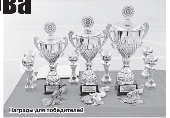
Награды для победителей