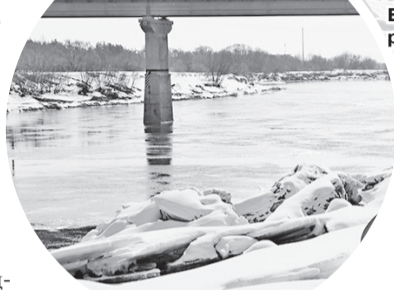
Такие торосы могут быть смертельно опасными

С начала года в стране под лед провалились и погибли 10 человек, из них двое детей. Свою роль сыграла в числе прочего и плюсовая температура этой зимой, делающая лед слабым и опасным. Однако трагические примеры никого не учат. Рейды, проводимые РОЧС и ОСВОД на водоемах Шкловщины, подтверждают это.